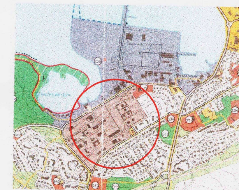
Stadsetning á gildandi aðalskipulagsupprætti

--- Afmörkun svæðis sem deiliskipulagsbreytingin nær yfir.