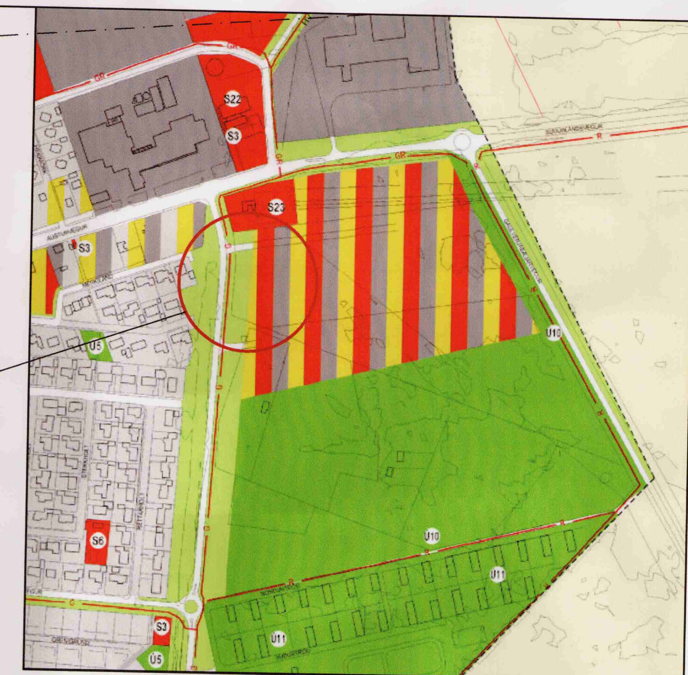
Áðalskipulag Árborgar 1995 - 2015