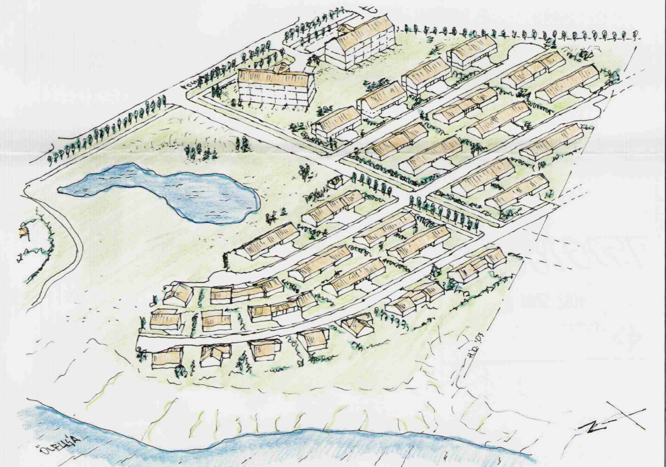
Yfirlitsmynd af 4. áfanga - reist grunnmynd