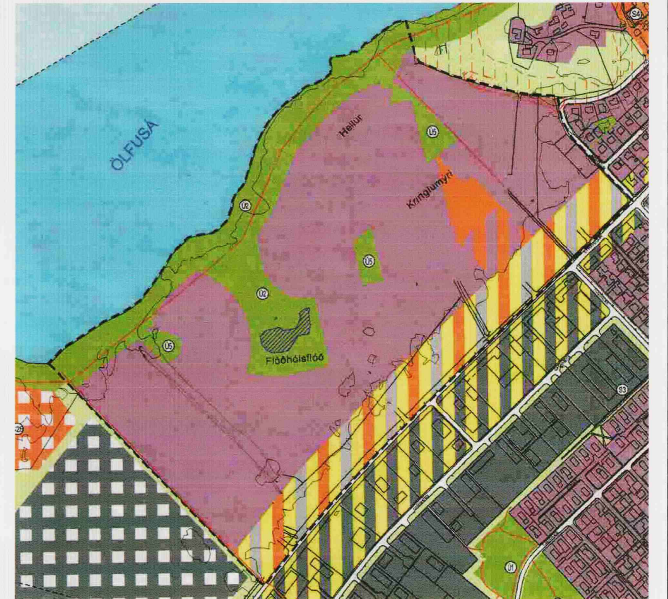
Gildandi aðalskipulag Fosslands - ekki í kvarða