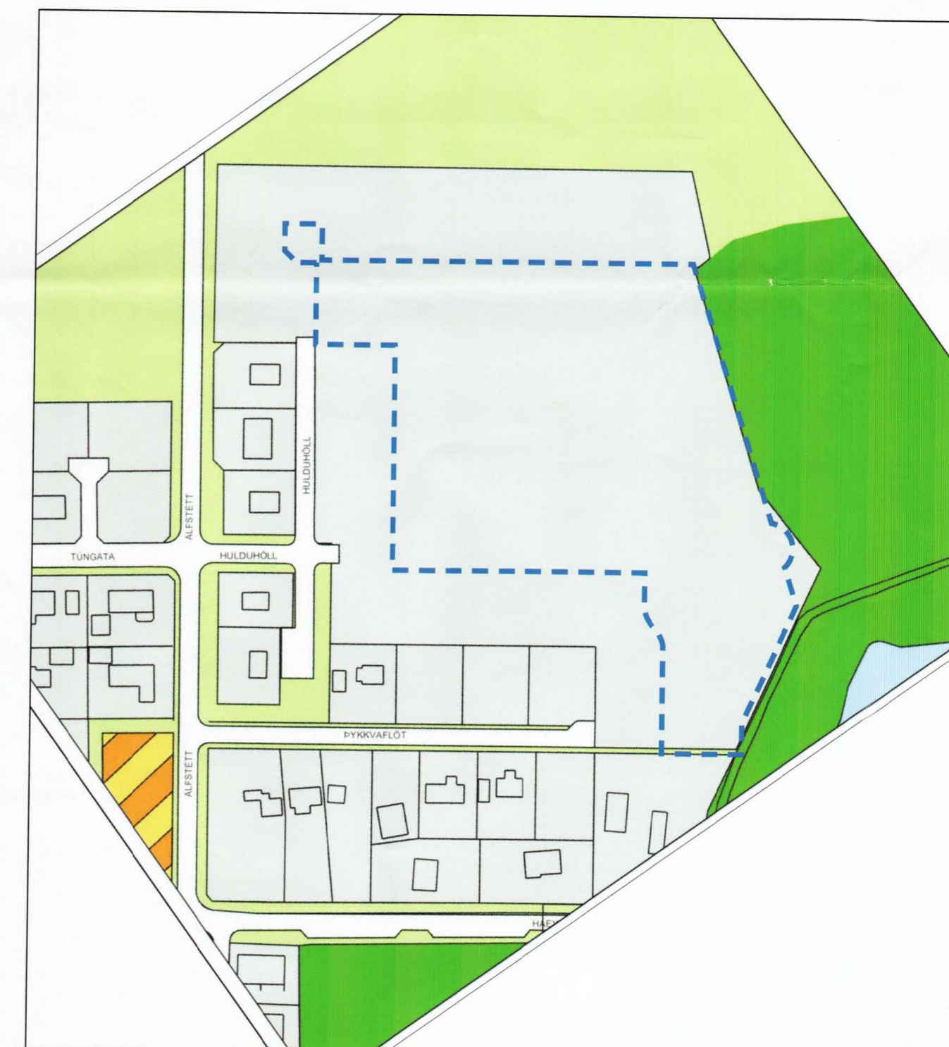
Núgildandi aðalskipulagi Eyrbakka sem breytt var 13. jan. 2005, Mkv. 1:2.000