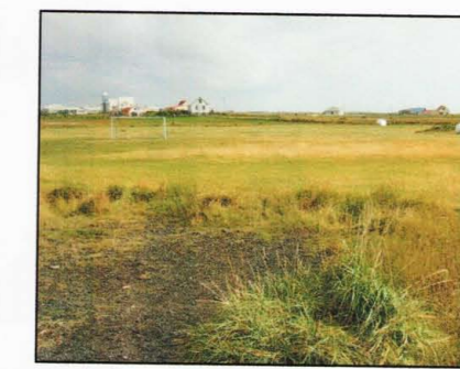
Horft til norðausturs yfir skipul.svæðið

Deiliskipulagsbreyting þessi var samþykkt af skipulags- og byggingarnefnd Árborgar