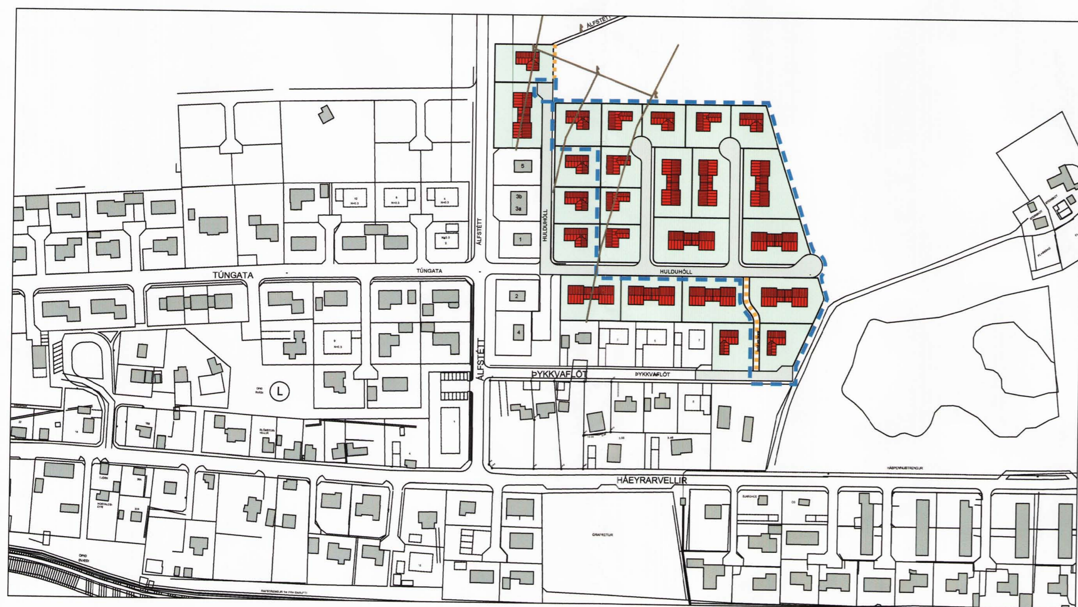
Skýringauppráttur í mkv. 1:2.500, ekki bindandi skipulag