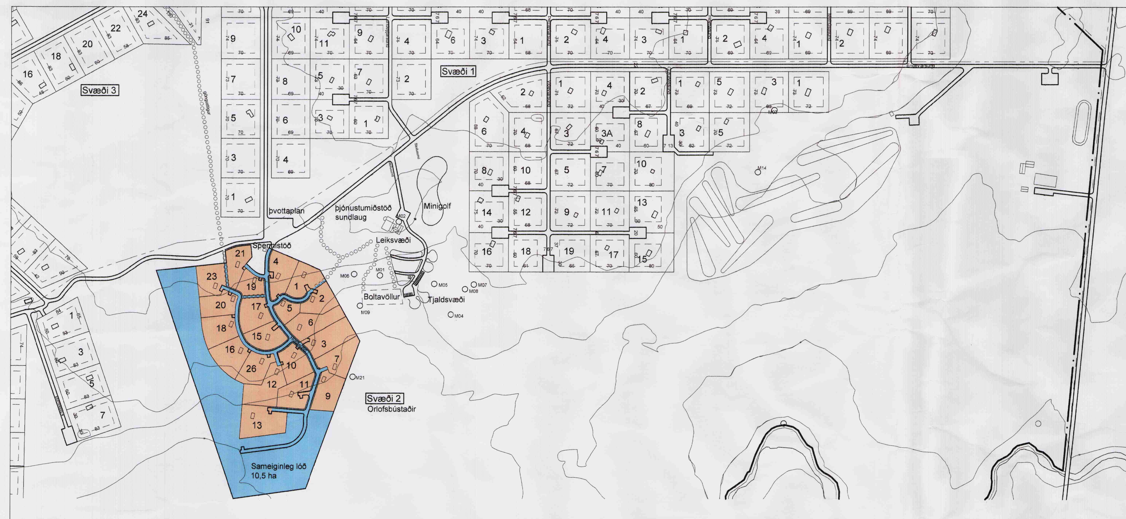
TILLAGA AÐ BREYTTU DEILISKIPULAGI 1:4000