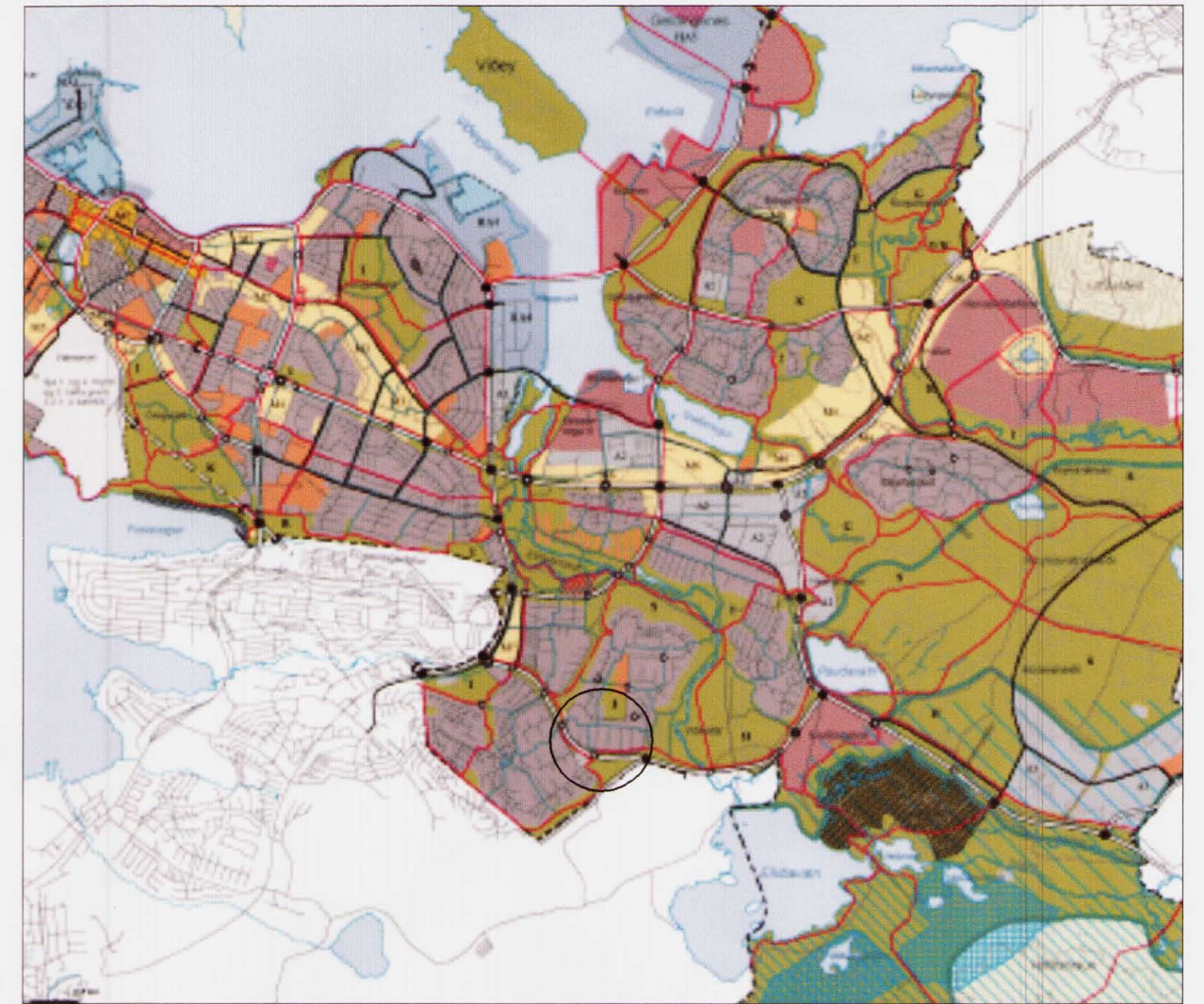
Hluti aðalskipulags Reykjavíkur 2001–2024

Halli skal vera í samræmi við íbúðahúsin. Þakið þarf ekki að vera allt úr gleri. Veggir skulu vera úr gleri (og timbri) svo að heildaryfirbragð raðhúsalengjunnar haldist. Mænir glerskála skal vera a.m.k. hálfum meter lægri en mænir íbúðahúss. Glerskálar skulu ekki ná út fyrir bílskúrinn sem þeir standa á.