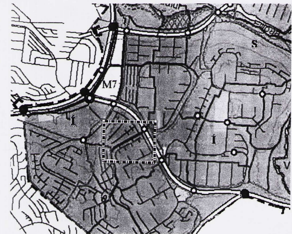
Hluti af Aðalskipulagi Reykjavíkur 2001 - 2024 Mörk breytingar merkt inn á.

Deiliskipulagsbreyting þessi sem fengið hefur meðferð í samræmi við ákvæði 2. mgr. 26. gr. skipulags- og byggingalaga nr. 73/1997 var samþykkt í SKIPULAGSRÁÐI þann 19. júlí 2006 .