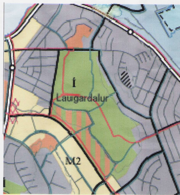
HLUTI AÐALSkipulags REYKJAVÍKUR 2001 – 2024

Aðkomu að svæðinu verður breytt vegna hringtorgs, sbr. samþ. samgöngunefndar.