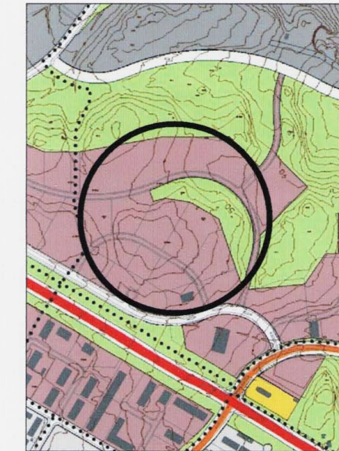
Aðalskipulag Akureyrar 1998-2018 Mælikvarði 1:10.000

Lagt er til að byggingarreitur verði stækkaður til að koma fyrir útbýggingu og fyrirkomulagi bílastæða breytt. Að öðru leyti gildi ákvæði skipulagsins óbreytt.