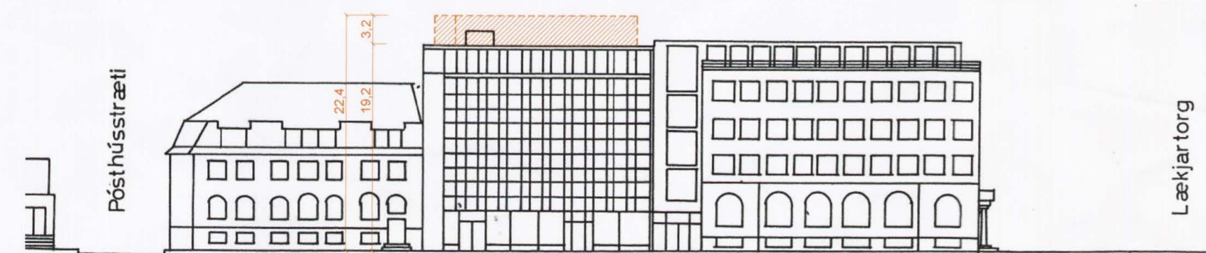
Skýringaruppráttur - Mkv. 1:500 Austurstræti að norðan