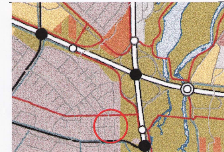
Hluti Aðalskipulags Rvk. 2001-2024