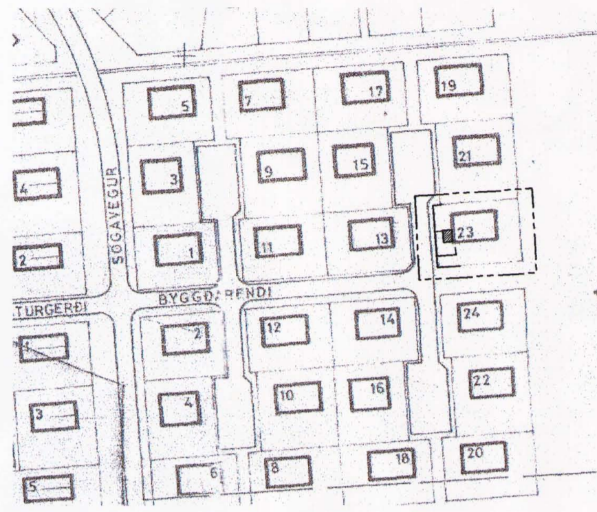
Tillaga að breyttu deiliskipulagi 1:2000