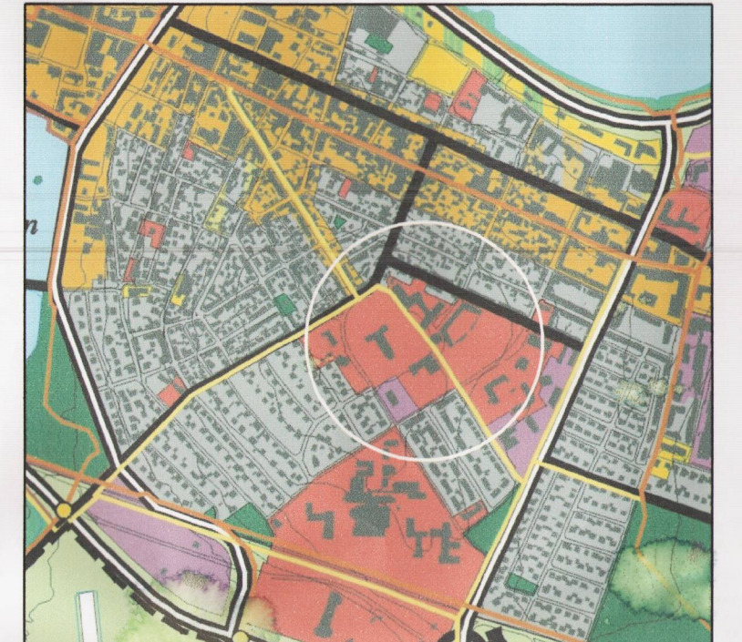
ADALSKIPULAG REYKJAVÍKUR 1996-2016 MKV. 1:20.000

FORSENDUR FYRIR ENDURSKOÐUN Á GILDANDI DEILISKIPULAGI: • Vegna almennra óska um fjölgun bílastæða á deiliskipulagssvæðinu; • Vegna formlegs erindis Landspítala Háskóla-sjúkrahúss (dags. 14.06.'01) er varðar stækkun lóðar Eiriksstaða og fjölgun bílastæða