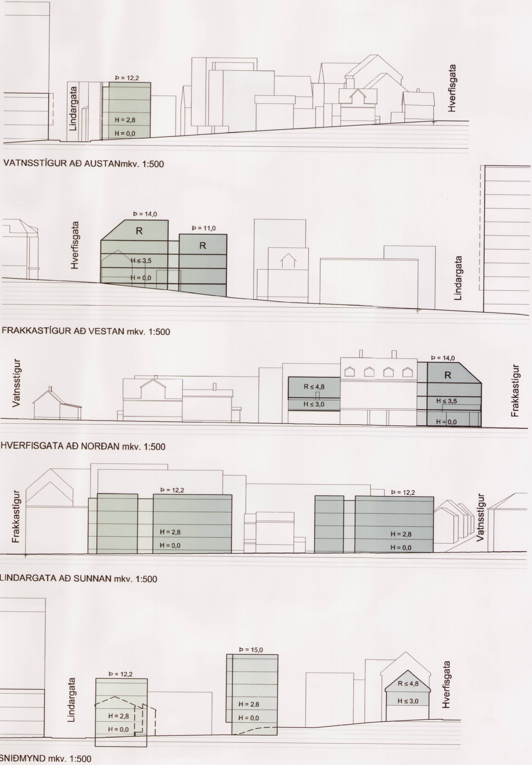
SNIDMYND m kv. 1:500