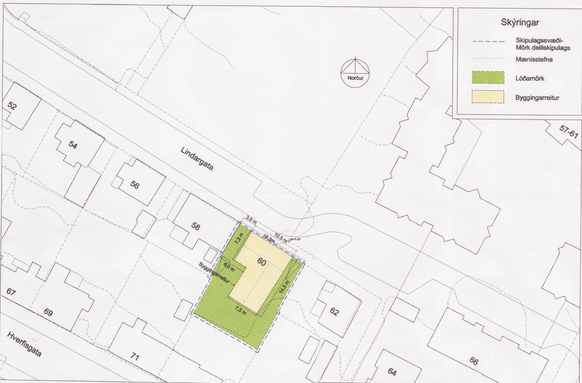
Nýtt deiliskipulag af lóð nr. 60 við Lindargötu.