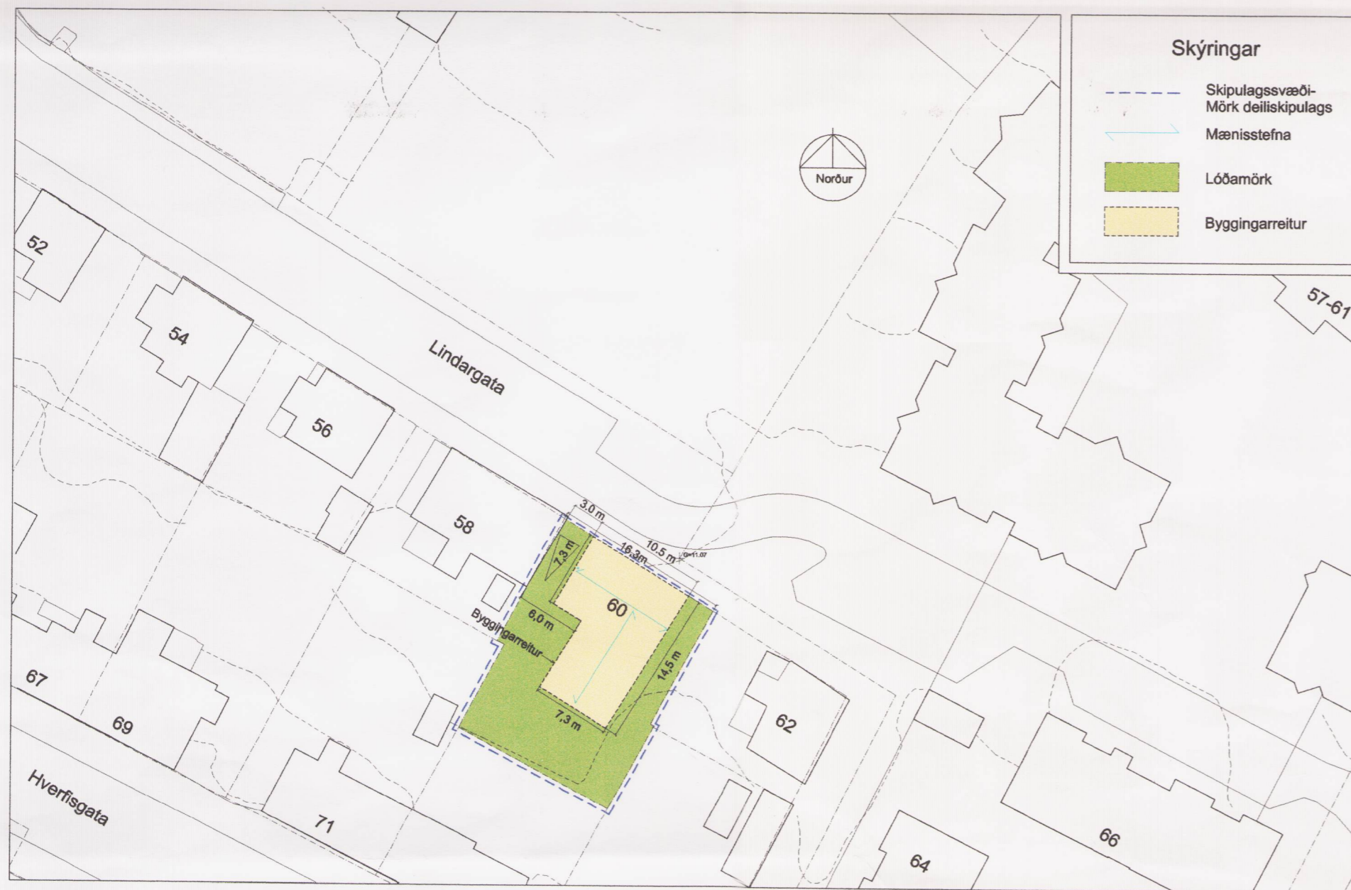
Gildandi deiliskipulag af lóð nr. 60 við Lindargötu, samþykkt í skipulags- og byggingarnefnd, 24.04.2002