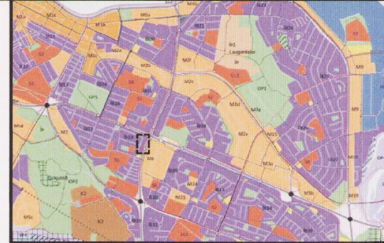
YFIRLITSMYND ÚR ADALSKIPULAGI 2010-2030