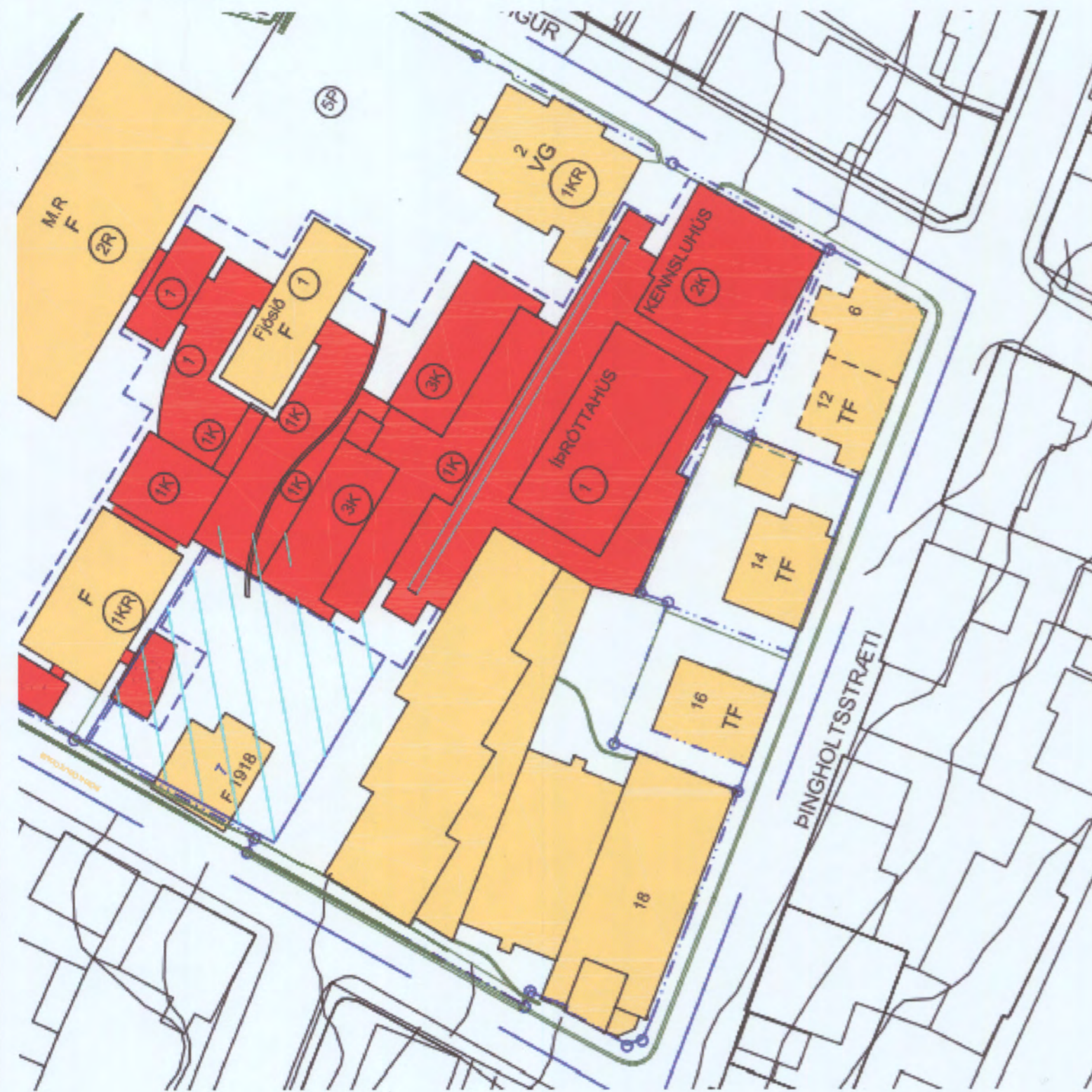
Gildandi deiliskipulag "MR" samþykkt í borgarráði dags. 17. apríl 2008 og birt í B-deild Stjórnartíðinda dags. 2. júní 2008.