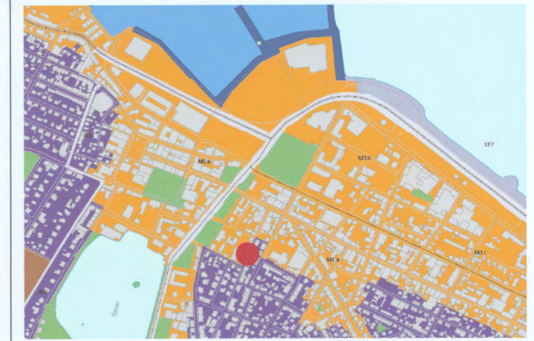
Hluti Aðalskipulags Reykjavíkur 2010-2030 Staðsetning svæðis