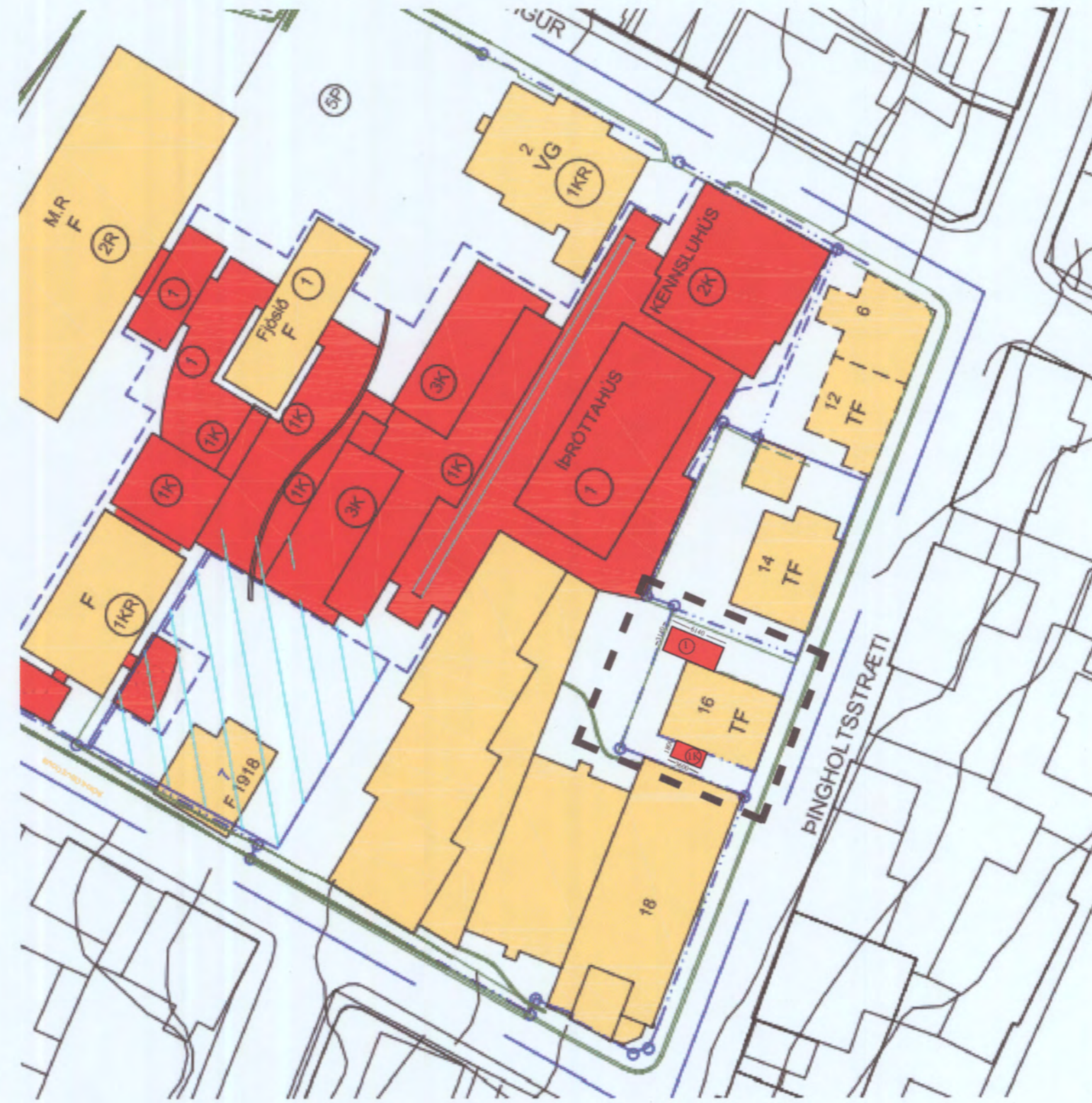
Tillaga að breyttu deiliskipulagi vegna Þinghóltsstræti 16