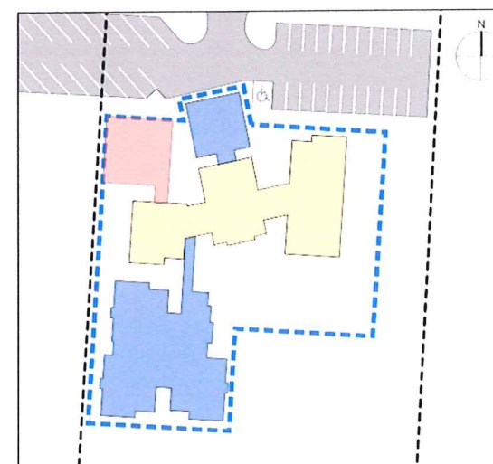
Skýringarmynd mkv. 1:1250