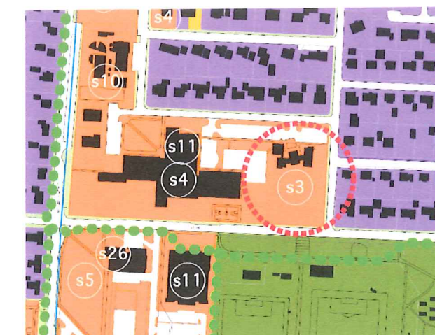
Útdráttur úr aðalskipulagi Árborgar 2010 - 2030, ekki í kvarða. Brotin rauð lína í hring sýnir svæði sem breytist.

Samþykkt deiliskipulagsbreytingarinnar var auglýst í B-deild Stjórnartíðinda þann