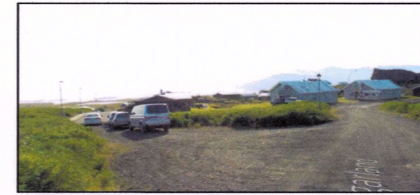
Mynd 2. Óbyggð svæði milli Hlíðar og Borgarlands

Í tillögu að breytingu á aðalskipulagi er gert ráð fyrir að íbúðarsvæði sunnan Borgarlands stækki um 1.000 m 2 til vesturs þar sem nú er óbyggð svæði. Með þessu móti þéttist byggð og á sýnd götunnar verður heildstæðari.