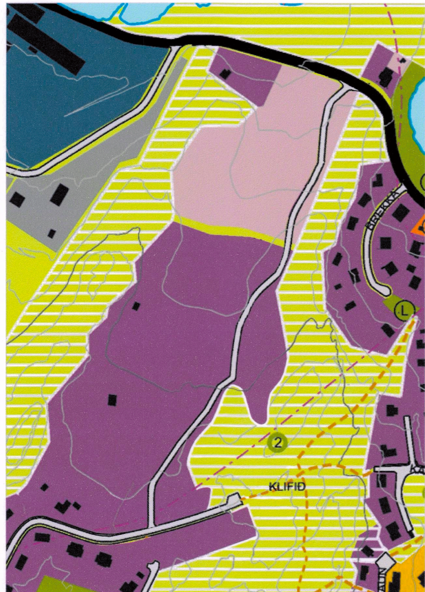
BREYTING Á AÐALSKIPULAGI DJÚPAVOGSHREPPS 2008-2020. MÆLIKVARÐI 1:5.000

Sveitarstjórn Djúpagshrepps samþykkti á fundi sínum þann 13. júní 2019 óverulega breytingu á Aðalskipulagi Djúpagshrepps 2008 - 2020, sem tekur til íbúðarsvæðis í efsta hluta Borgarlands og færslu á veltengingu milli Borgarlands og Víkurlands.