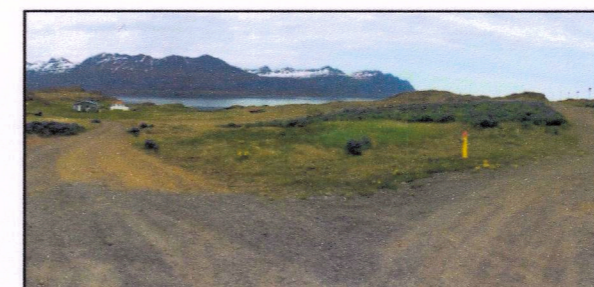
Mynd 3. Horft frá Borgarlandi til norðurs í átt að Víkurlandi

Aðalskipulagsbreytingin gerir ráð fyrir að veltenging milli Borgarlands og Víkurlands verði færð til austurs. Hún verði betur felld að landi og látin renna saman við núverandi veg um svæðið nokkru sunnan við mörk frístundabyggðarsvæðis. Með þessu móti skapast betri möguleikar á heildstæðari byggð og öruggara umhverfi á svæðinu, þar sem tengingin mun fara um jaðar byggðar en ekki um hana miðja.