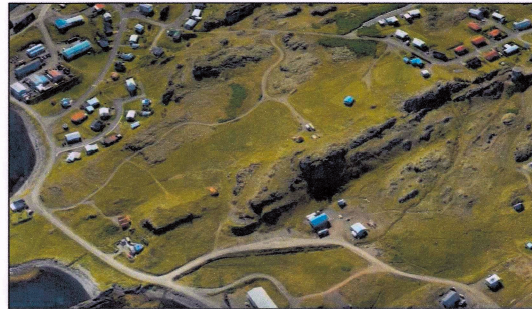
Mynd 1. Efsti hluti Borgarlands og íbúðar- og frístundarsvæði norðan þess. Veltenging milli Borgarlands og Víkurlands liggur frá miðri mynd til vinstri