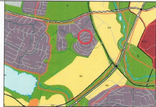
HLUTI AF AÐALSKIPULAGI REYKJAVÍKUR 2001 - 2024

Deiliskipulagsbreyting þessi, sem hefur fengið meðferð í samræmi við ákvæði 2. mgr. 26. gr. skipulags- og byggingarlaga nr. 73/1997 var samþykkt í SKIPULAGSRÁÐI þann 1. mars 200 6