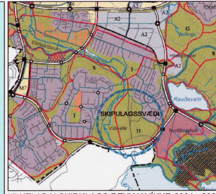
HLÚTI ADALSKIPULAGS REYKJAVÍKUR 2001 - 2024 samþykkt í desember 2002