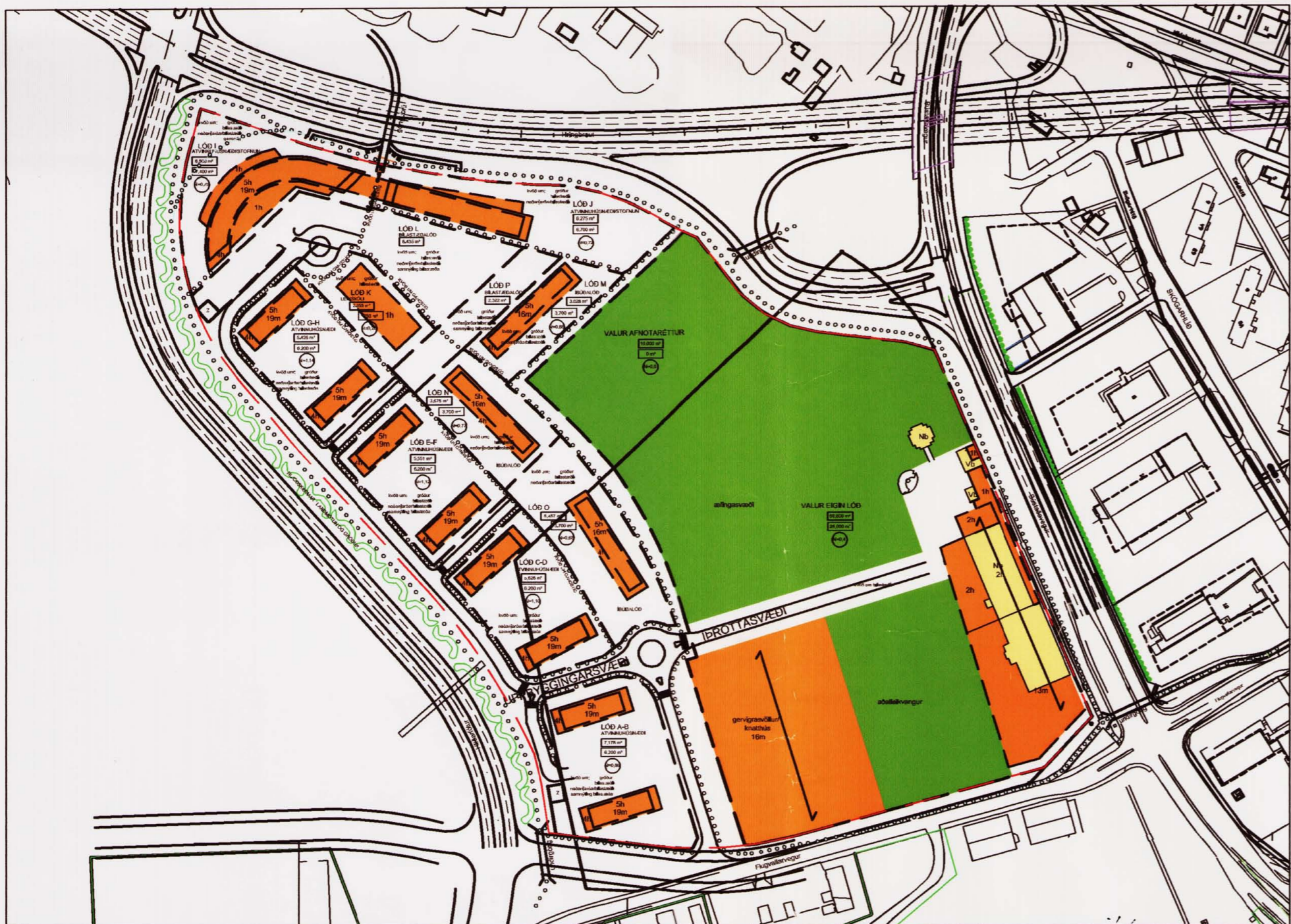
FYRIR Deiliskipulag samþykkt í borgarráði þann 15. júlí 2003