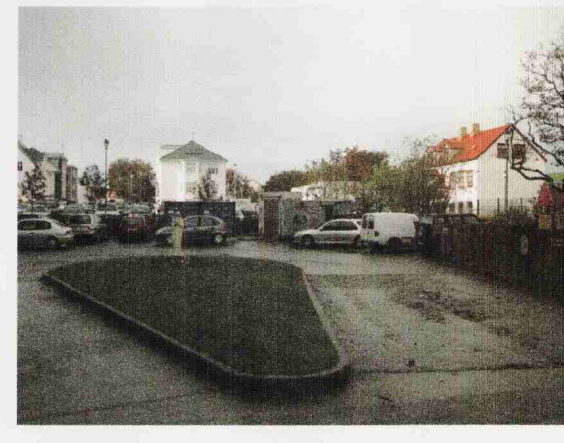
ÁSYND Á BAKLÓÐ

Deiliskipulagsbreyting. Túngata 26 - LSH Landakot Landnúmer 100 655 Fastanúmer 0-1-1137201