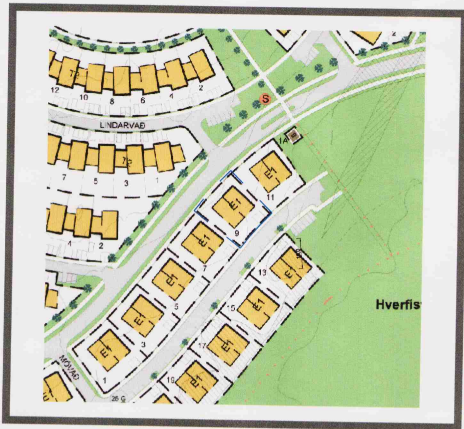
Hluti gildandi deiliskipulags "Norðlingaholts" 1:2000 samb. í borgarráði 11 apríl 2003 með síðari breytingum