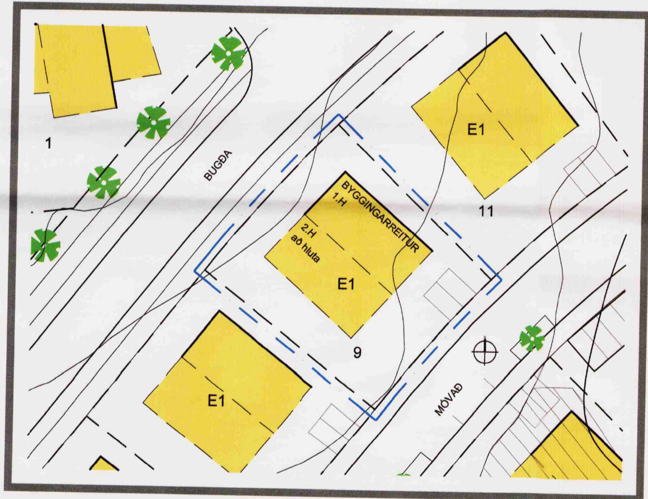
Skipulagsskilmálar samkvæmt gildandi deiliskipulagi Mkv. 1:500