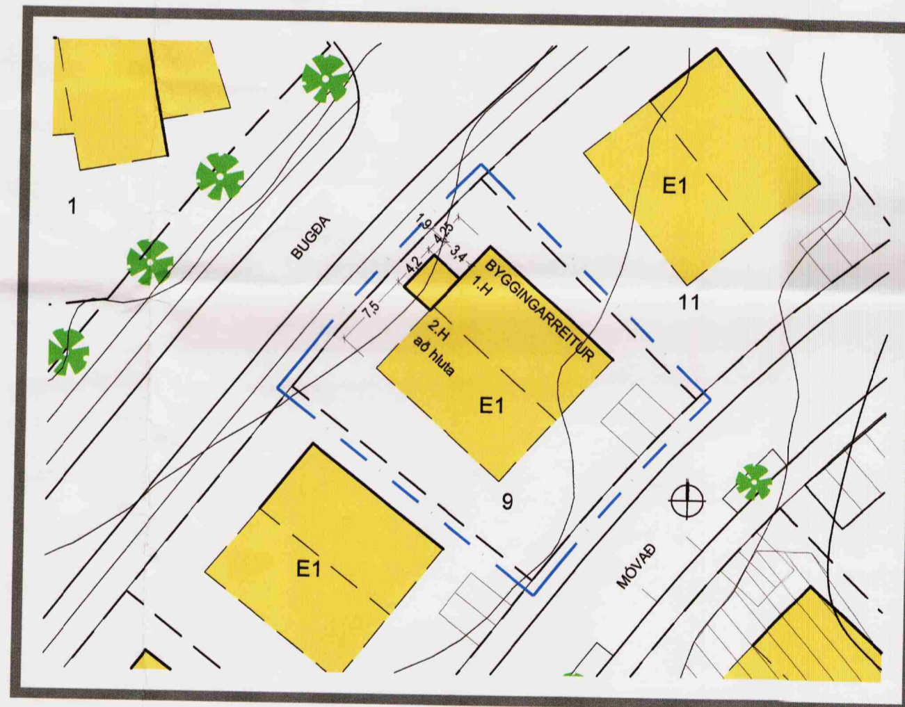
Skipulagsskilmálar samkvæmt tillögu að breytingu á deiliskipulagi Mkv. 1:500