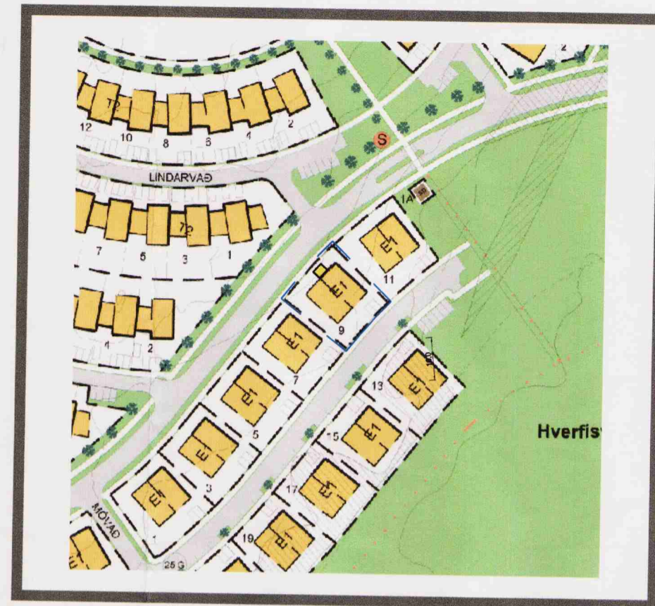
Tillaga að breytingu á deiliskipulagi 1:2000