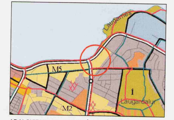
ADALSKIPULAG REYKJAVÍKUR 2001-2024