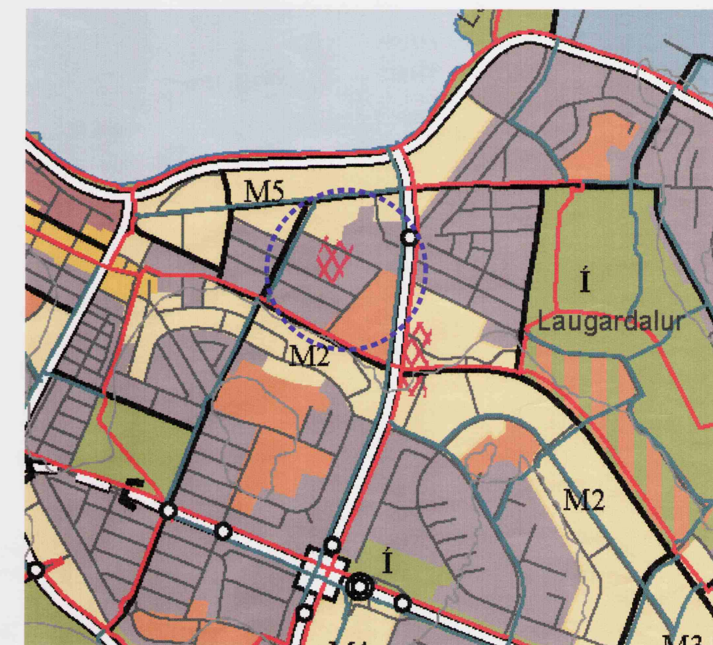
ADALSKIPULAG REYKJAVÍKUR 2001-21

og að bílastæðabókhalld breytist í samræmi við það, þ.e. lágmarkskröfu skv. byggingarreglugerð verður fullnægt.