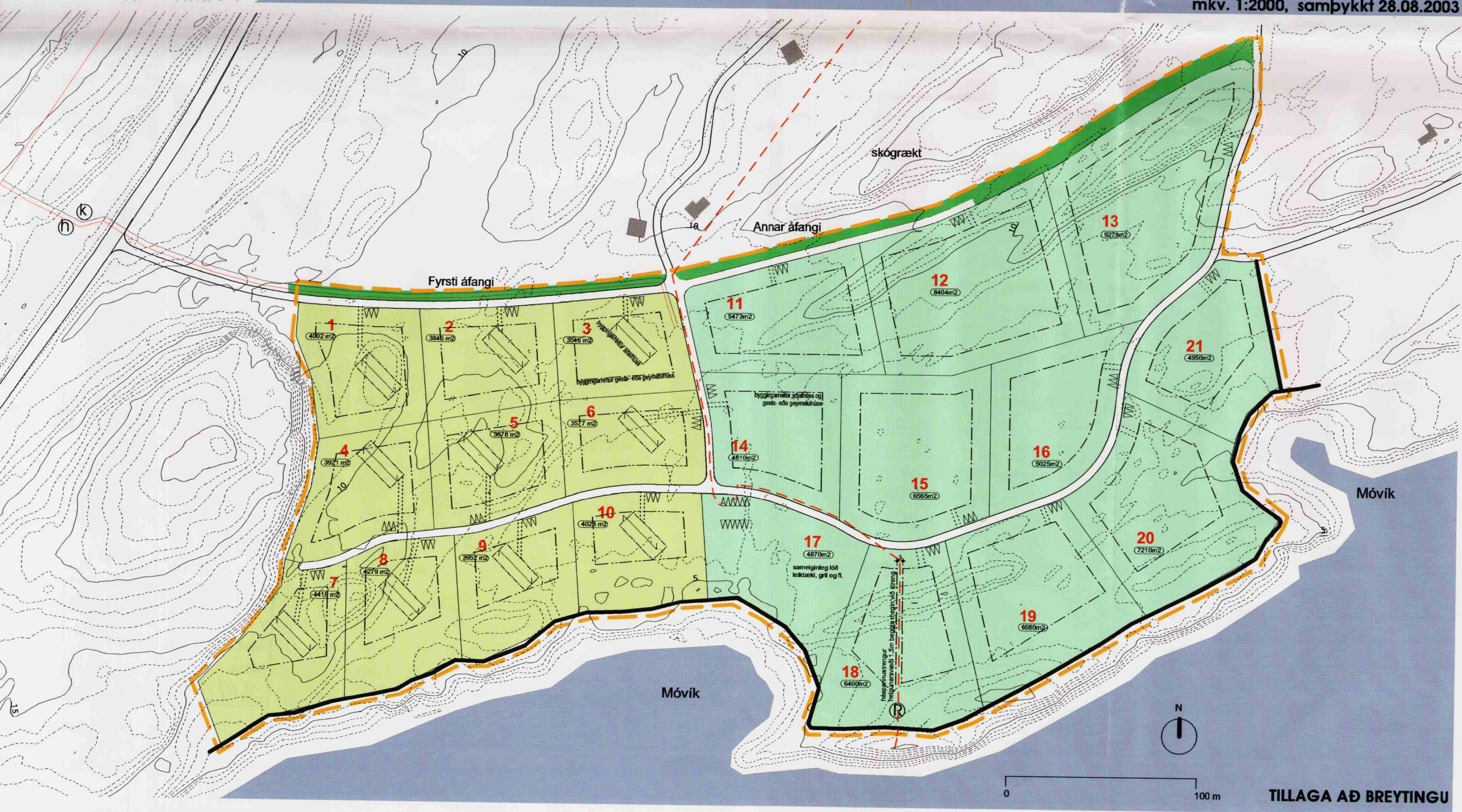
TILLAGA AÐ BREYTINGU