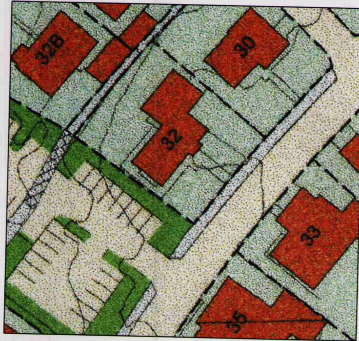
GILDANDI SKIPULAG, KVARDI 1:500