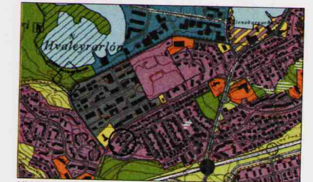
HLUTI AF ADALSKIPULAGI HAFNARFJARÐAR 2005 - 2025

STAÐSETNING BREYTINGAR Á ADALSKIPULAGSUPPDRAETTI