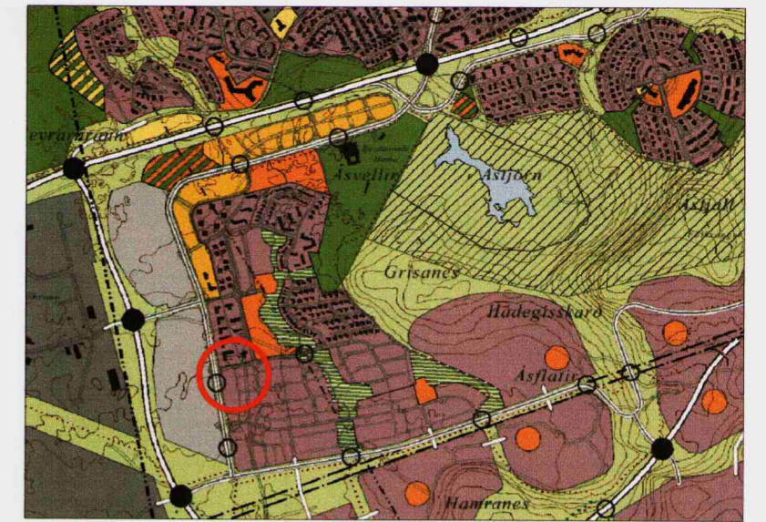
Aðalskipulag Hafnarfjarðar 2005-2025

Breytingin felur í sér lítilsháttar tilfærslu til suðurs á innkeyrslu á lóð nr. 21 við Eskivelli og staðsetning sorpkassa.