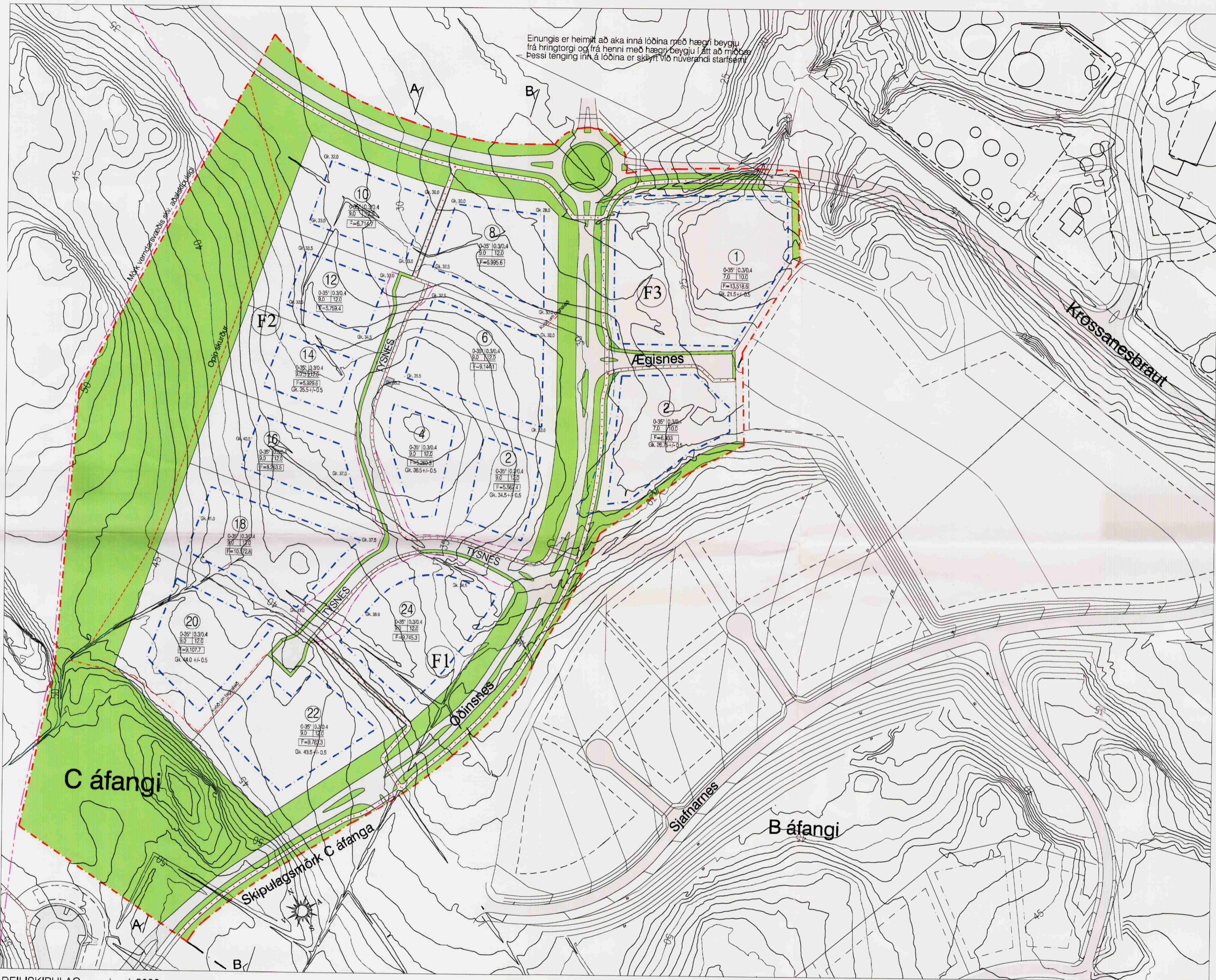
DEILISKIPULAG - mkv. 1:2000