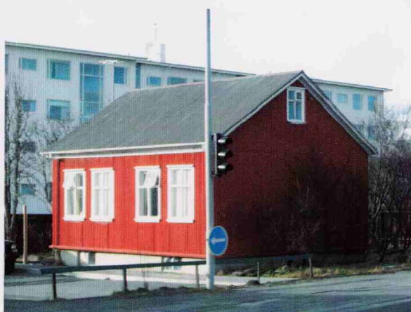
Viðimelur 80 / Kaplaskjólsvogar 2