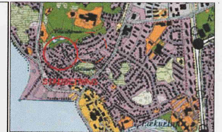
ADALSKIPULAG HAFNARFJARÐAR 2005 - 2025

Deiliskipulag þetta, sem hefur fengið meðferð skv. 2. mgr. 26. gr. Skipulags- og byggingarlaga nr. 73/1997 var samþykkt af Skipulags- og byggingarfulltrúa Hafnarfjarðar.