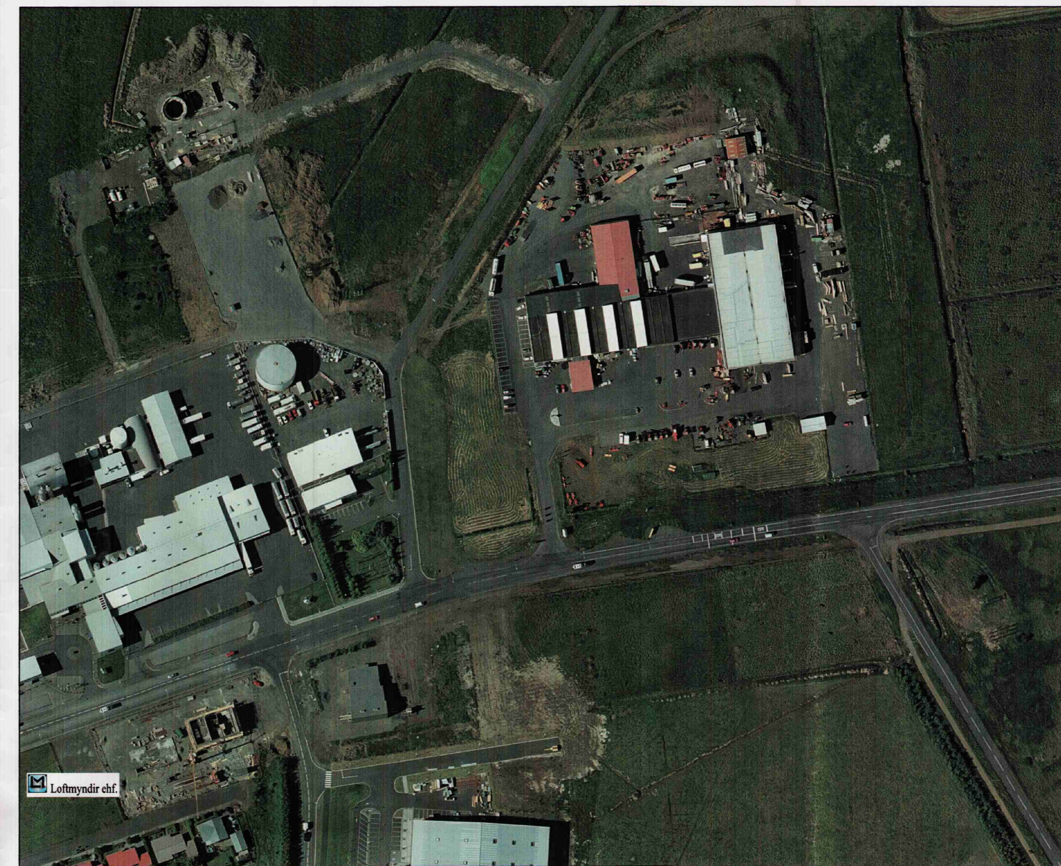
Yfirlitsmynd í mkv. 1:2.000

Deiliskipulag þetta var samþykkt af skipulags- og byggingarnefnd Sveitarfélagsins Árborg þann 20. maí 2009 Deiliskipulag þetta var auglýst frá 08/04 til 20/05 2009 Deiliskipulag þetta, sem fengið hefur meðferð samkv. gr. 25 í lögum nr. 73/1997 var samþykkt í bæjarstjórn þann 25. maí 2009 [Signature] skipulagsfulltrúi / bæjarstjóri Árborgar Auglýsing um gildistöku deiliskipulagsins var birt í B-deild stjórnartíðinda þann _____ 2009