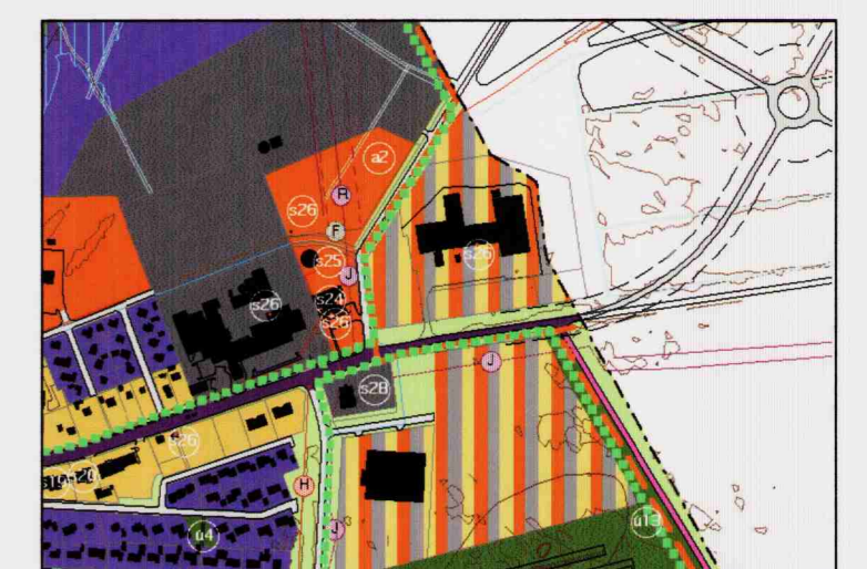
Úr gildandi aðalskipulagi Árborgar 2005-2025

Deiliskipulag þetta var samþykkt af skipulags- og byggingarnefnd Sveitarfélagsins Árborg þann 20. maí 2009 Deiliskipulag þetta var auglýst frá 08/04 til 20/05 2009 Deiliskipulag þetta, sem fengið hefur meðferð samkv. gr. 25 í lögum nr. 73/1997 var samþykkt í bæjarstjórn þann 25. maí 2009 [Signature] skipulagsfulltrúi / bæjarstjóri Árborgar Auglýsing um gildistöku deiliskipulagsins var birt í B-deild stjórnartíðinda þann _____ 2009