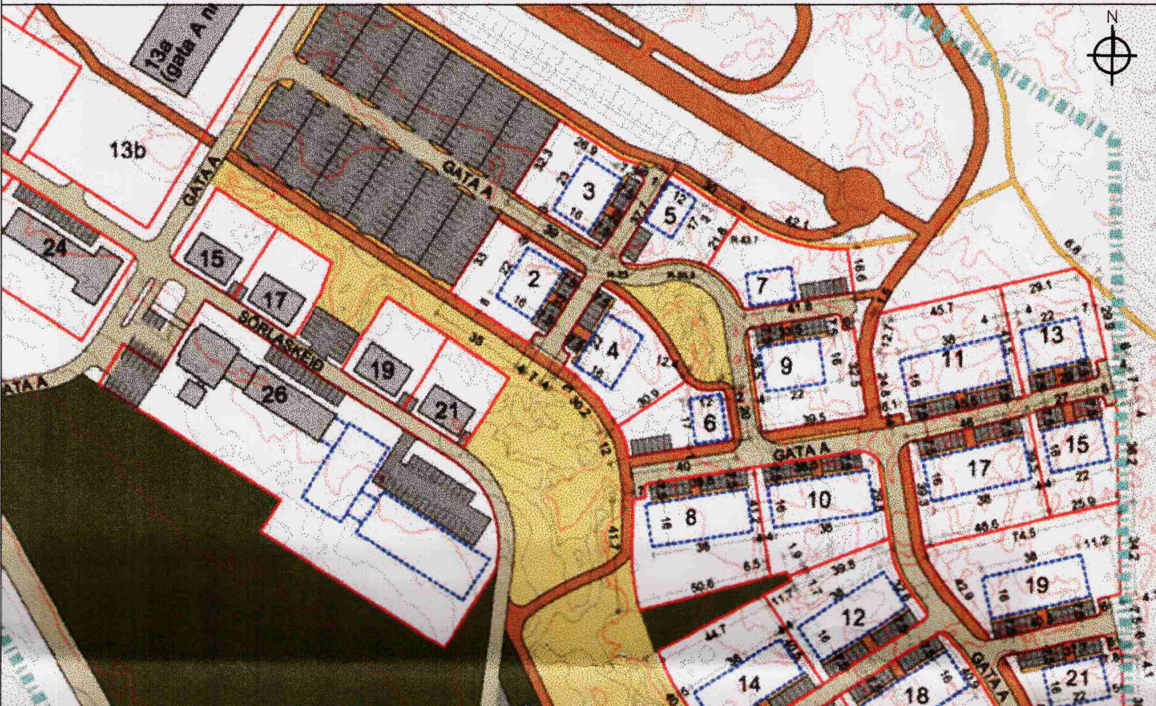
Hluti af gildandi deiliskipulagi athafnasvæðis hestamannafélagsins Sörla Mkv. 1:2000, sem samþykktur var af bæjarstjórn þann 29.01.2008.

Mörk deiliskipulagsbreytingar ———— Lóðamörk ———— Byggingarreitir afmarkandi lína ————