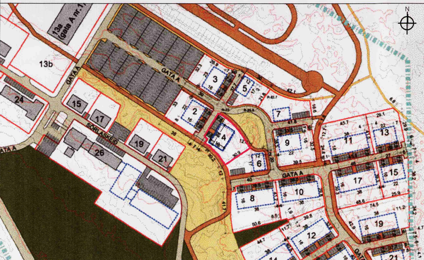
Tillaga að breytingu á deiliskipulagi athafnasvæðis hestamannafélagsins Sörla Mkv. 1:2000.