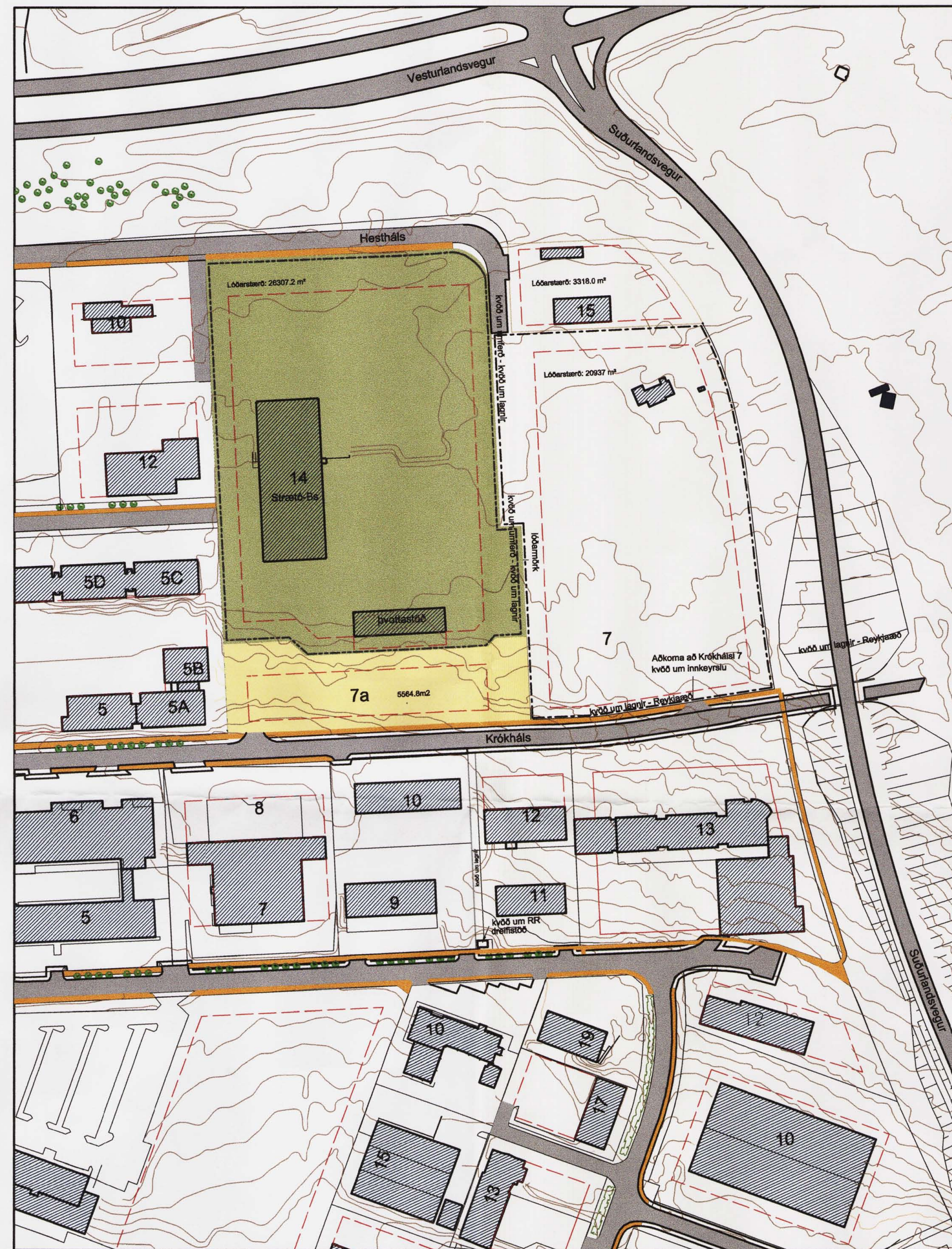
Hestháis 14 og Krókháis 7 - Fyrir breytingu Gildandi skipulag frá 15.11.2007.