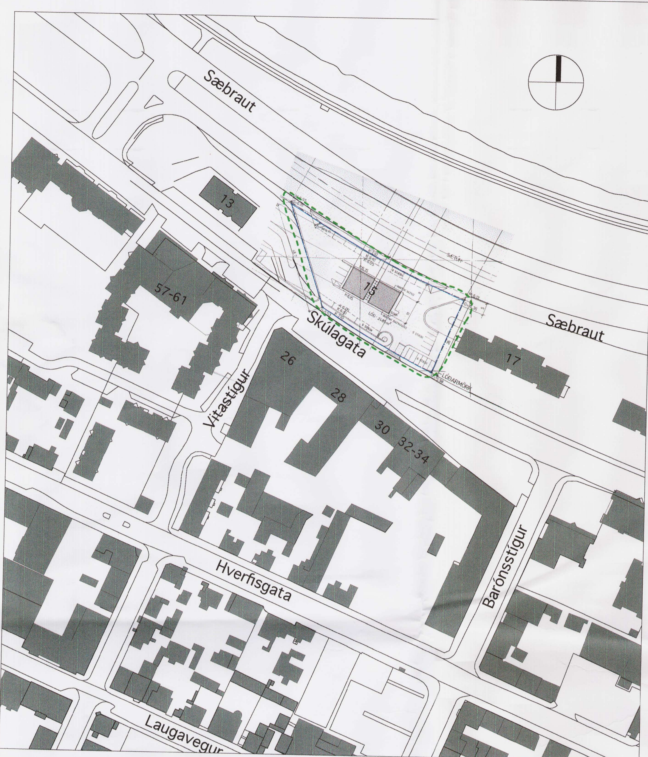
Uppdrættir sýna aðeins deiliskipulagsákvæði fyrir lóðina Skúlagata 15. Umhverfi lóðarinnar er frá LUKR

SVÆÐI: _____ MÆLIKVARDI: _____ SIDASTA DAGSETNING: Mkv. 1:1000 TEIKNINGARNÚMÉR: 15.05.2007 BREYTING: D 01 03