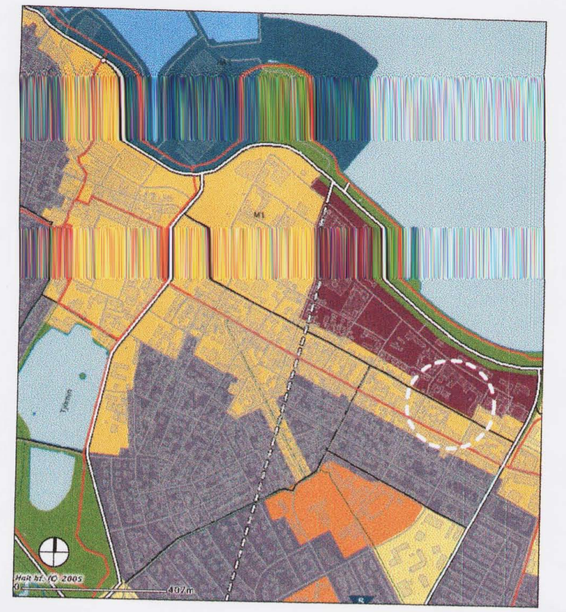
HLUTI ABALSKIPULAGS REYKJAVÍKUR 2001-2024