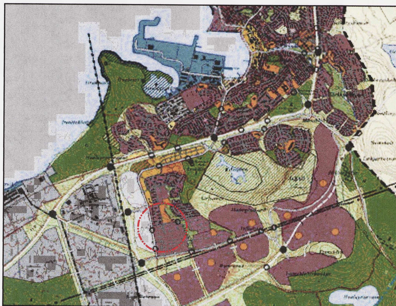
Hluti af aðalskipulagi Hafnarfjarðar.