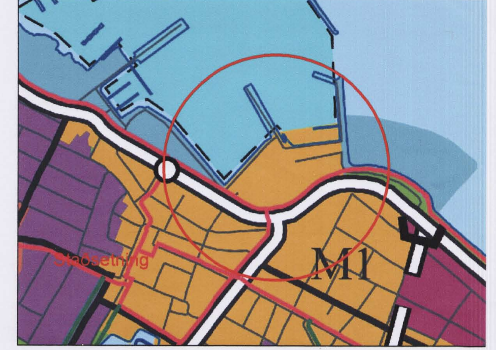
Aðalskipulag Reykjavíkur 2001-2024. Stefna um landnotkun Austurhafnar