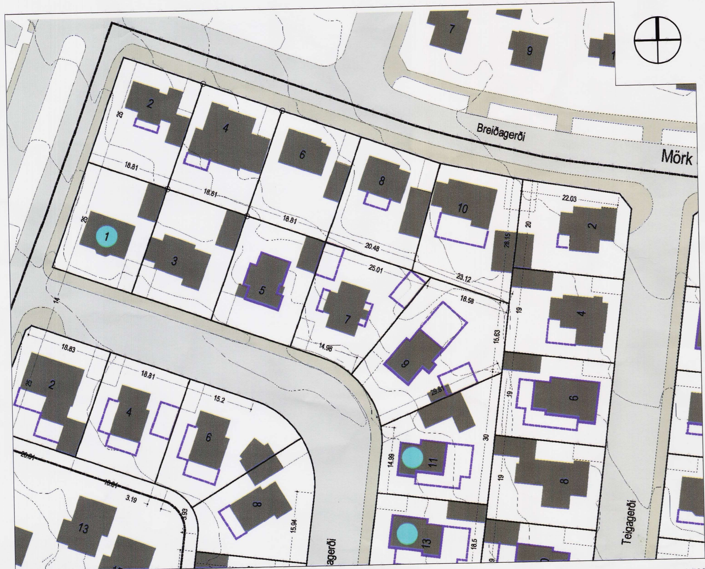
m = 1:500