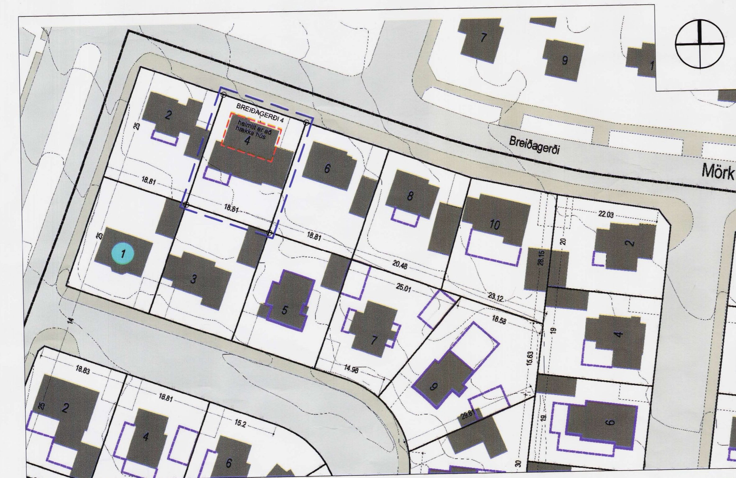
m = 1:500