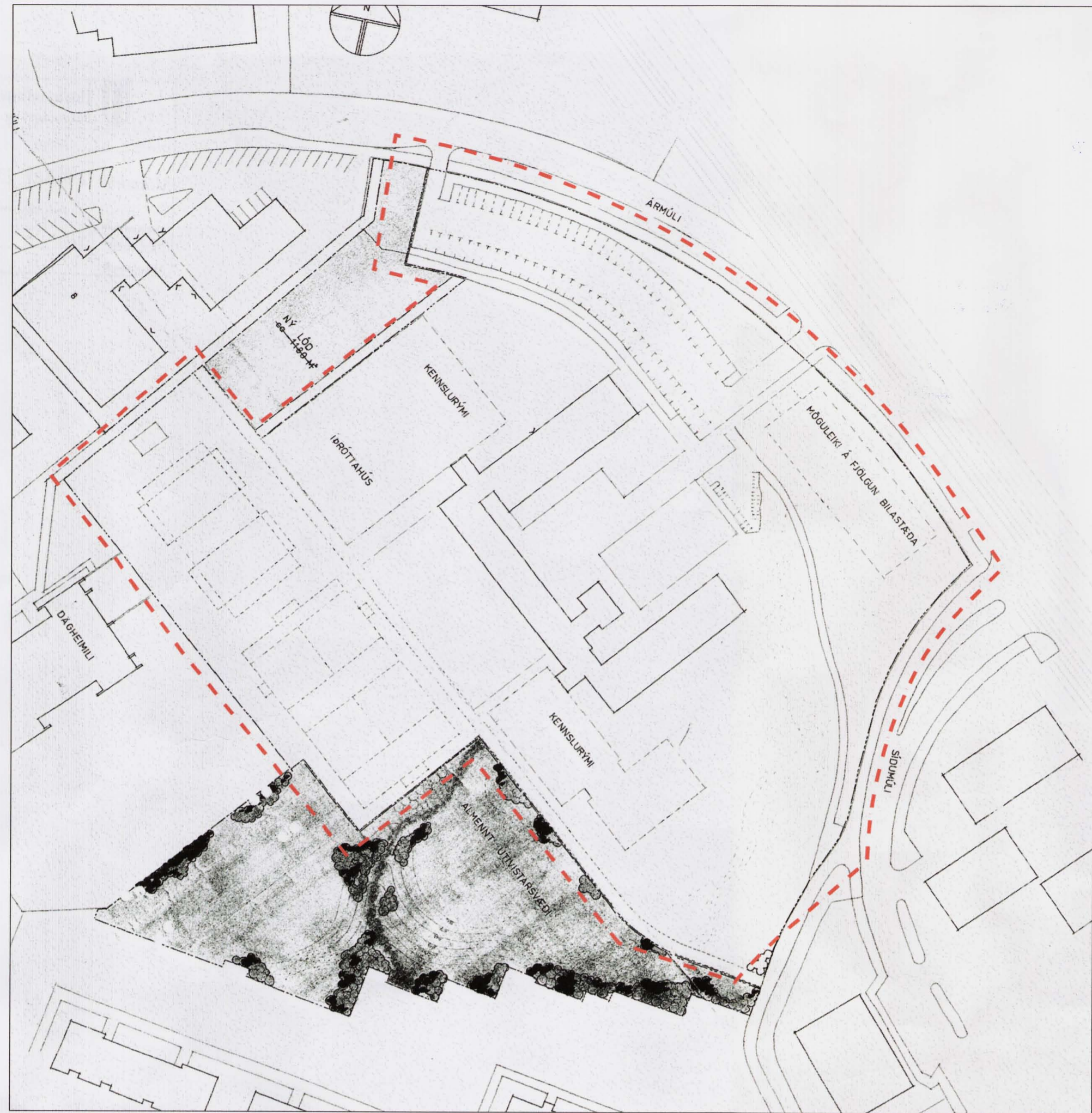
LÓÐ ÁRMÚLLASKÓLA - GILDANDI DEILISKIPULAG M 1:1000

Í gildi er deiliskipulag samþykkt í skipulagsnefnd þann 21.11.1983 og samþykkt í borgarráði þann 31.01.1984. Kvæðir: Á lóðinni að Ármúla 10 er kvæð um umferð fyrir Ármúla 8 og 12 sbr. mæliblað samþykkt á fundi bygginganefndar 29.04.1999.