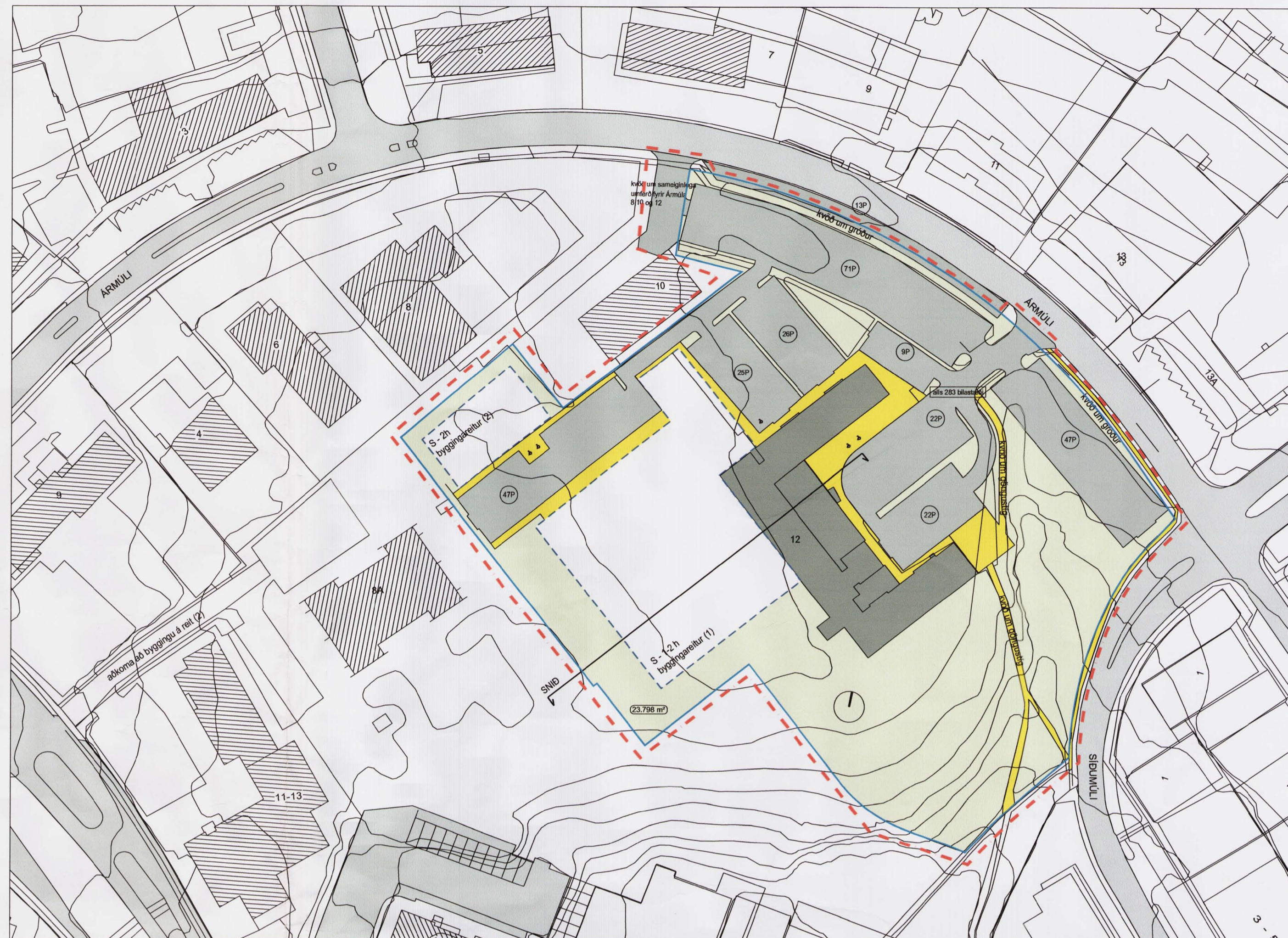
LÓÐ ÁRMÚLLASKÓLA - BREYTING Á DEILISKIPULAGI M 1:1000