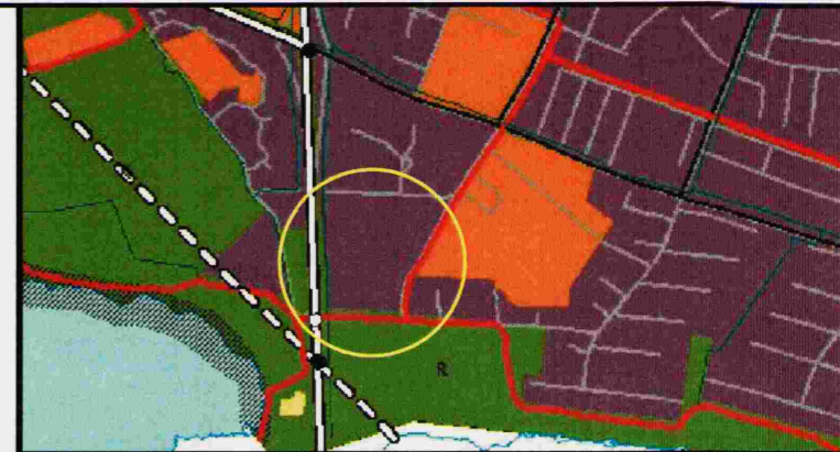
YFIRLITSMYND UR AÐALSKIPULAGI

Breytingin er gerð að beiðni Orkuveitu Reykjavíkur og felst í stækkun byggingarreits fyrir spennistöð og aukningu leyfilegs byggingarmagns, sem verður 60m 2 . Lóð stækkar í samræmi við þetta og verður 197m 2 . Byggingin er áfram ein hæð.