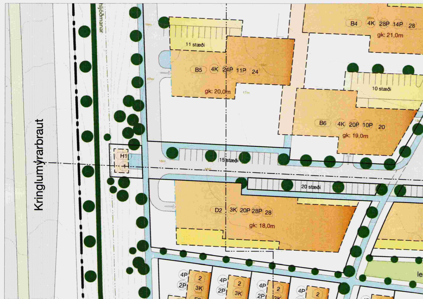
Tillaga að breytingu 21.01.2009 - mkv.1:1000