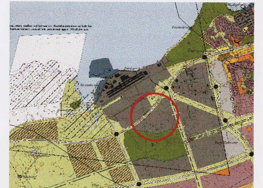
ADALSKIPULAG HAFNARFJARÐAR 2005 - 2025