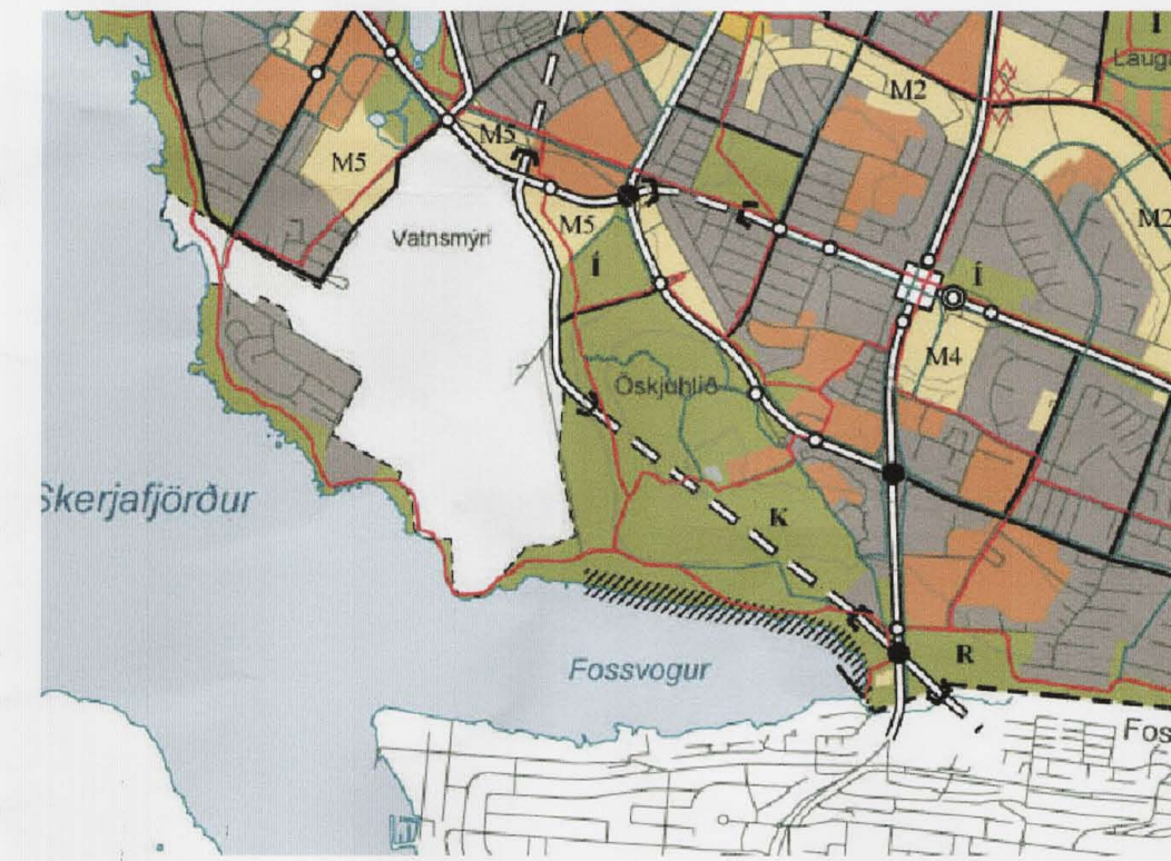
hluti af aðalskipulagi Reykjavíkur

Skýringaruppráttur er bindandi í meginatriðum á þann hátt að framsettar hugmyndir um staðsetningu og fyrirkomulag húskroppa eru bindandi, án þess að skýringarupprátturinn bindi endanlega staðsetningu bygginga, fjarlægðir milli byggingarhluta eða staðsetningu í landi, enda eru byggingarhlutar ávallt innan byggingarreits.