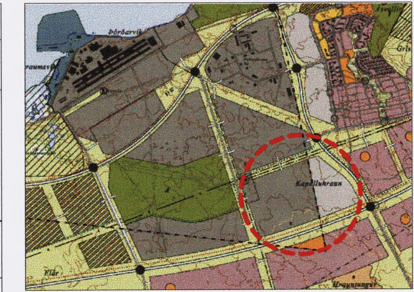
ADALSKIPULAG HAFNARFJARÐAR 2005 - 2025