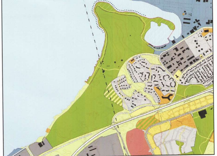
ADALSKIPULAG HAFNARFJARDAR 1995-2015