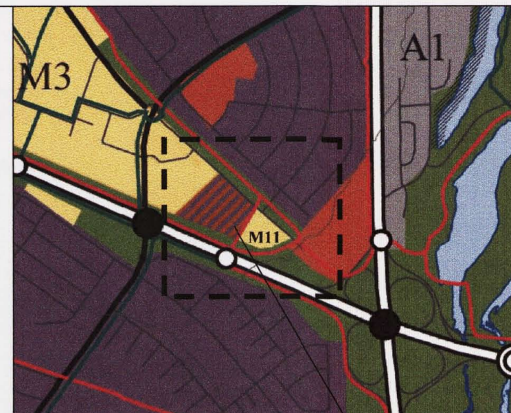
Aðalskipulag Reykjavíkur 2001-2024

Kvaðir um lagningu munu koma fram á mæliblöðum þar sem það á við.