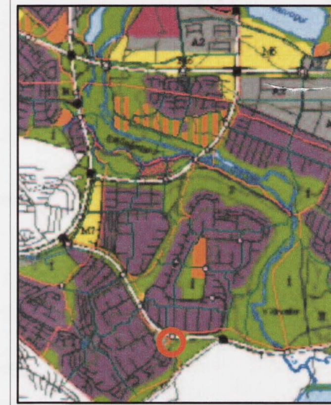
HLUTI AF ADALSKIPULAGI REYKJAVÍKUR 2001-2020

DEILISKIPULAGSBREYTING ÞESSI SEM FENGID HEFUR MEDFERÐ Í SAMRÆMI VÍÐ ÁKVÆÐI 2 mgr. 25 gr. SKIPULAGS- OG BYGGINGARLAGA nr. 73/1997 VAR SAMÞYKKT afari skipulagj þann 15. ágúst 2008 TILLAGN VAR AUGLÝST FRÁ 25. júní 2008 MEÐ ATHUGASEMDARFRESTI TIL 6. ágúst 2008 AUGLÝSING UM GILDISTÖKU BREYTINGARINNAR VAR BIRT Í B- deild STJÓRNATÍÐINDA ÞANN 2008