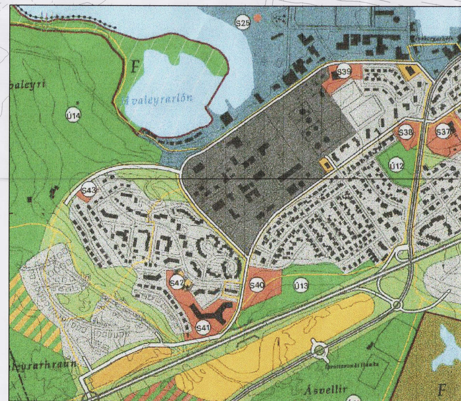
YFIRLITSMYND mkv. 1:10.000