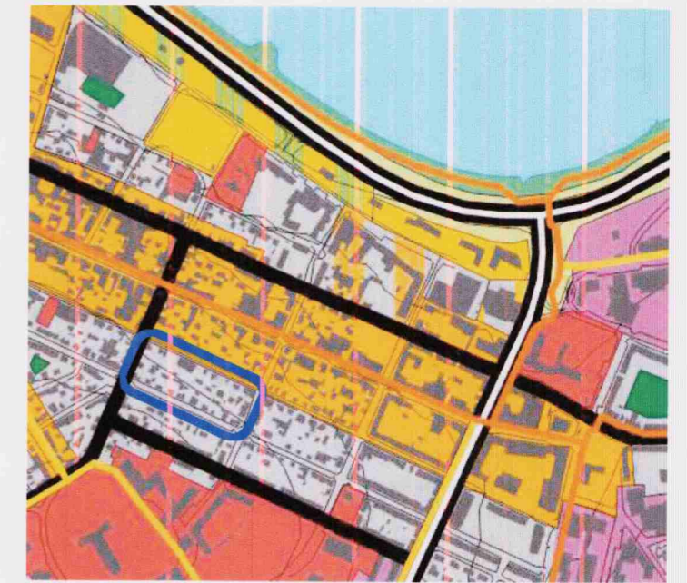
HLUTI AÐALSKIPULAGS REYKJAVÍKUR 1996-2016