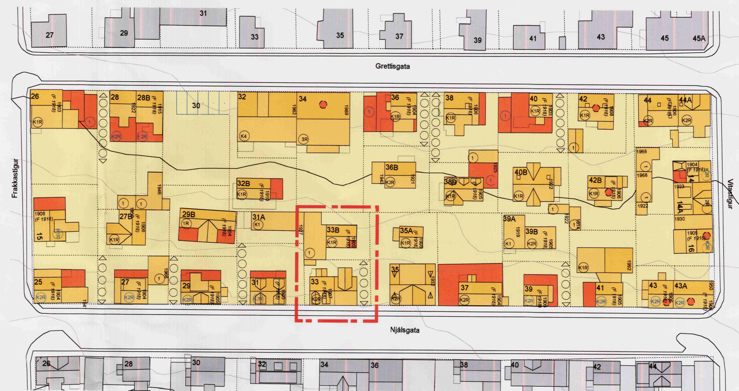
Deiliskipulagstillaga Mkv. 1:500