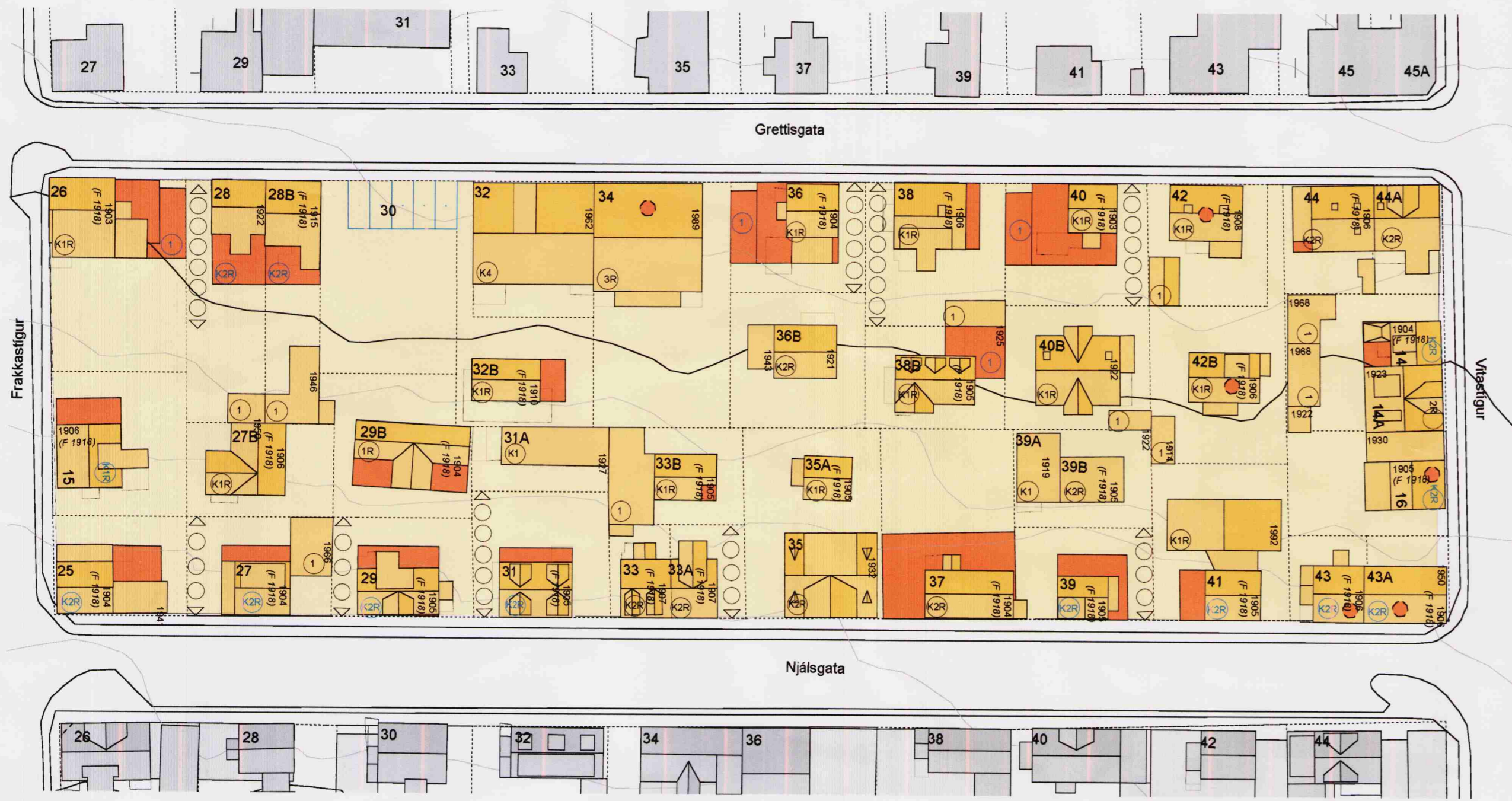
Gildandi deiliskipulag, samþ. í borgarráði 14. júní 2007 Mkv. 1:500