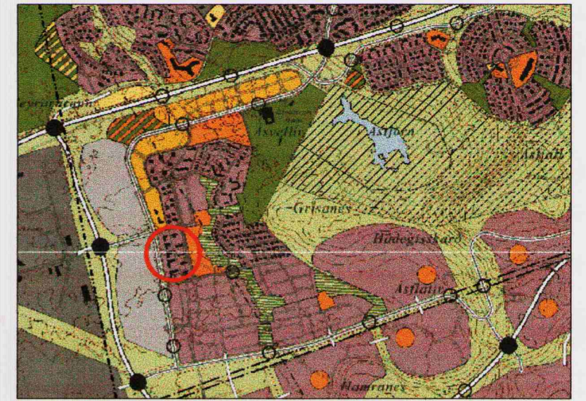
Aðalskipulag Hafnarfjarðar 2005-2025

Fjöldi bílastæða innan hvers lóðar skal uppfylla gr. 64 í byggingarreglugerð nr. 441/1998. Að öðru leiti gilda skipulagsskilmálar fyrir deiliskipulag Valla 5. áfanga dags. 9.1 2007 útgáfa 0.3.