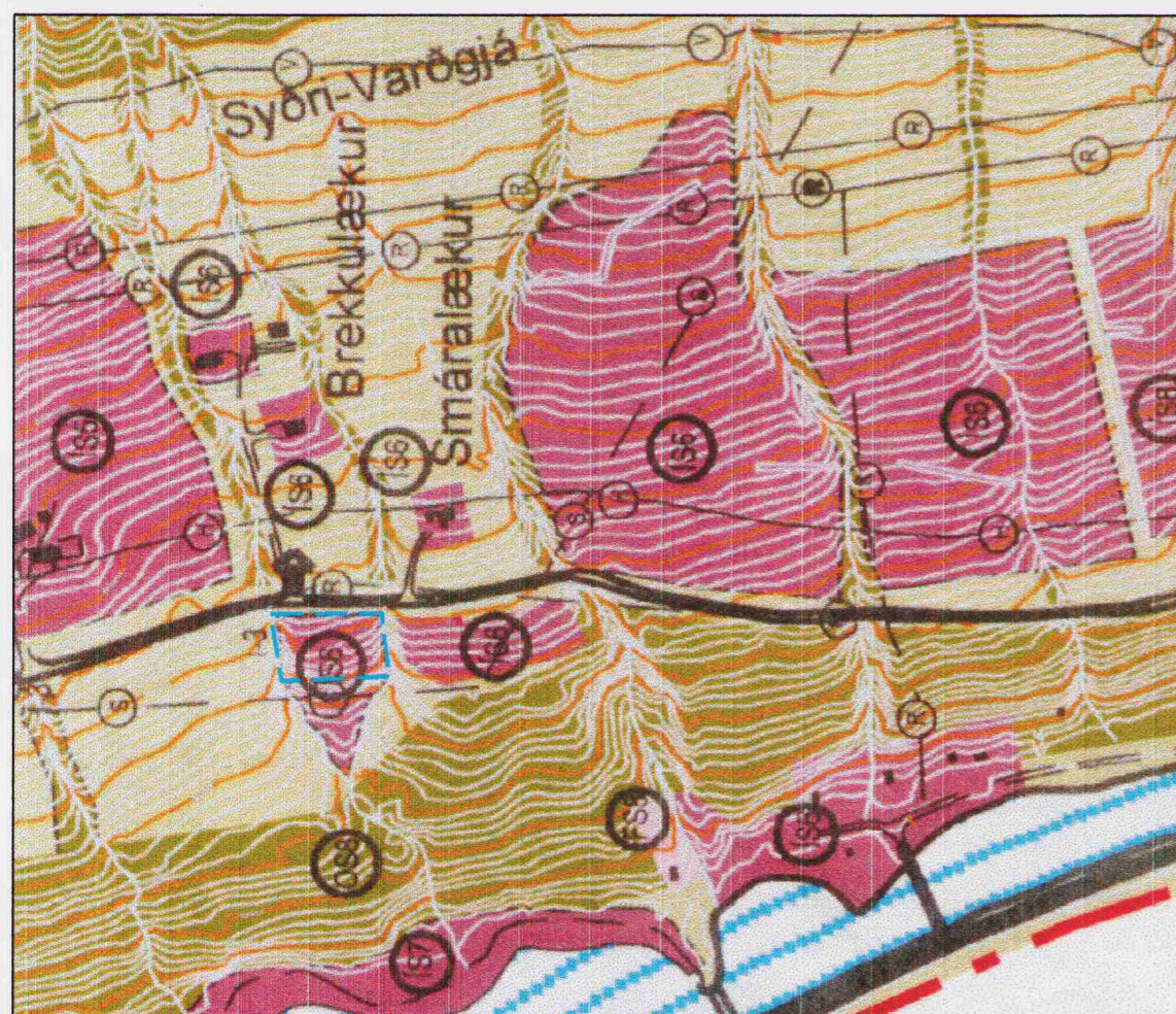
Aðalskipulag - 2005-2025

Skipulagstillagan var auglýst almenningi til sýnis skv. 25. gr. skipulags- og byggingarlaga nr. 73/1997 með síðari br.